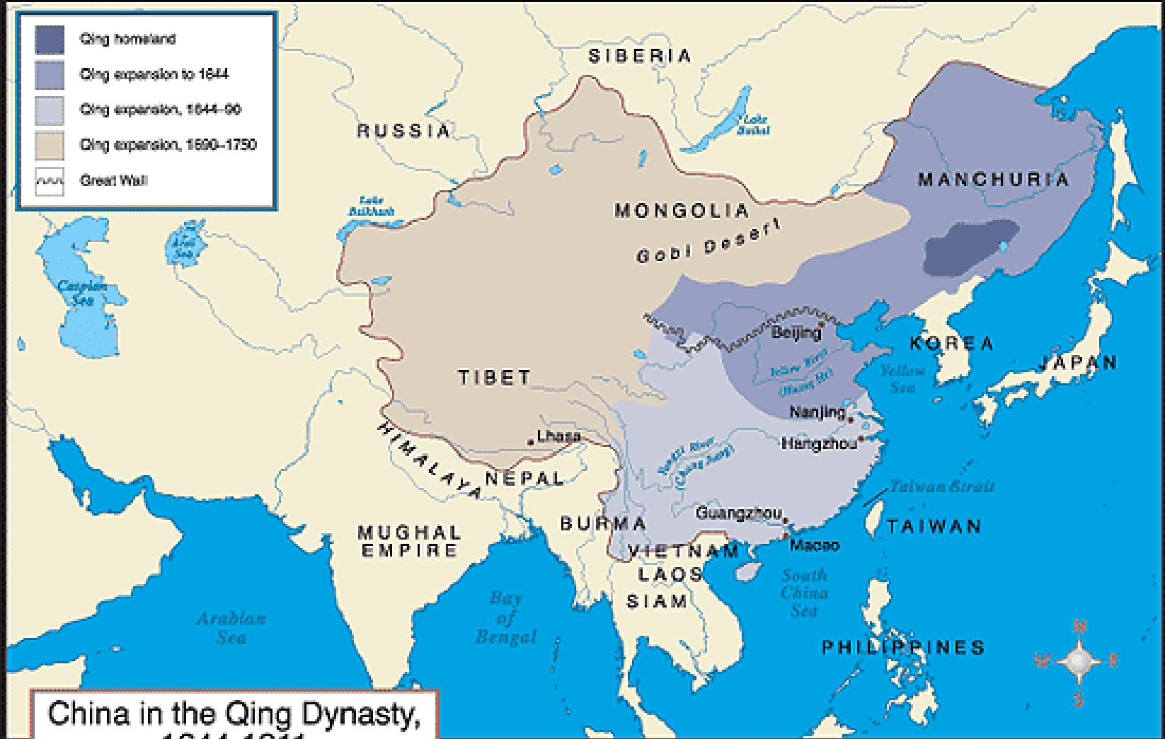
China in the Qing Dynasty, 1644-1911