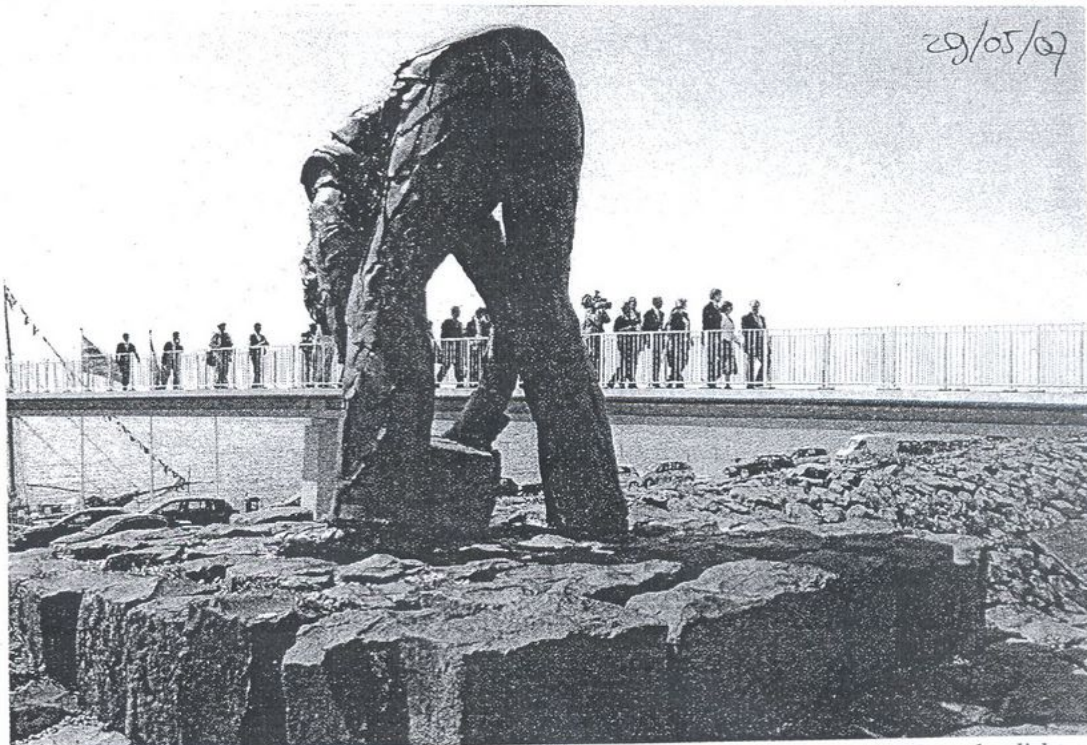
Tweede pinksterdag was het om 13.02 uur 75 jaar geleden dat het laatste gat in de Afsluitdijk werd gedicht met keileem en basaltblokken. Om het jubileum te vieren, hadden Rijkswaterstaat en de gemeenten Wieringen en Wunseradiel een feestprogramma samengesteld.

Ongeveer 8.000 km 2 van ons land is normaal zonder wateroverlast. In de rest van het 34.000 km 2 grote landoppervlak is men elk uur van de dag bezig met de 'waterstaat', d.w.z. met het buiten houden van zee- en rivierwater en het op peil houden van de waterstand in vaarten, slooten, plassen, enz.,