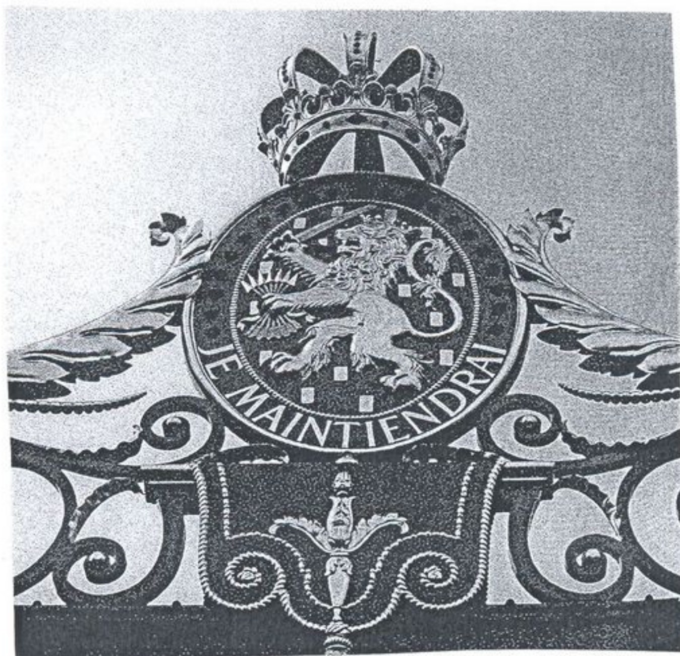
Het Nederlandse wapen