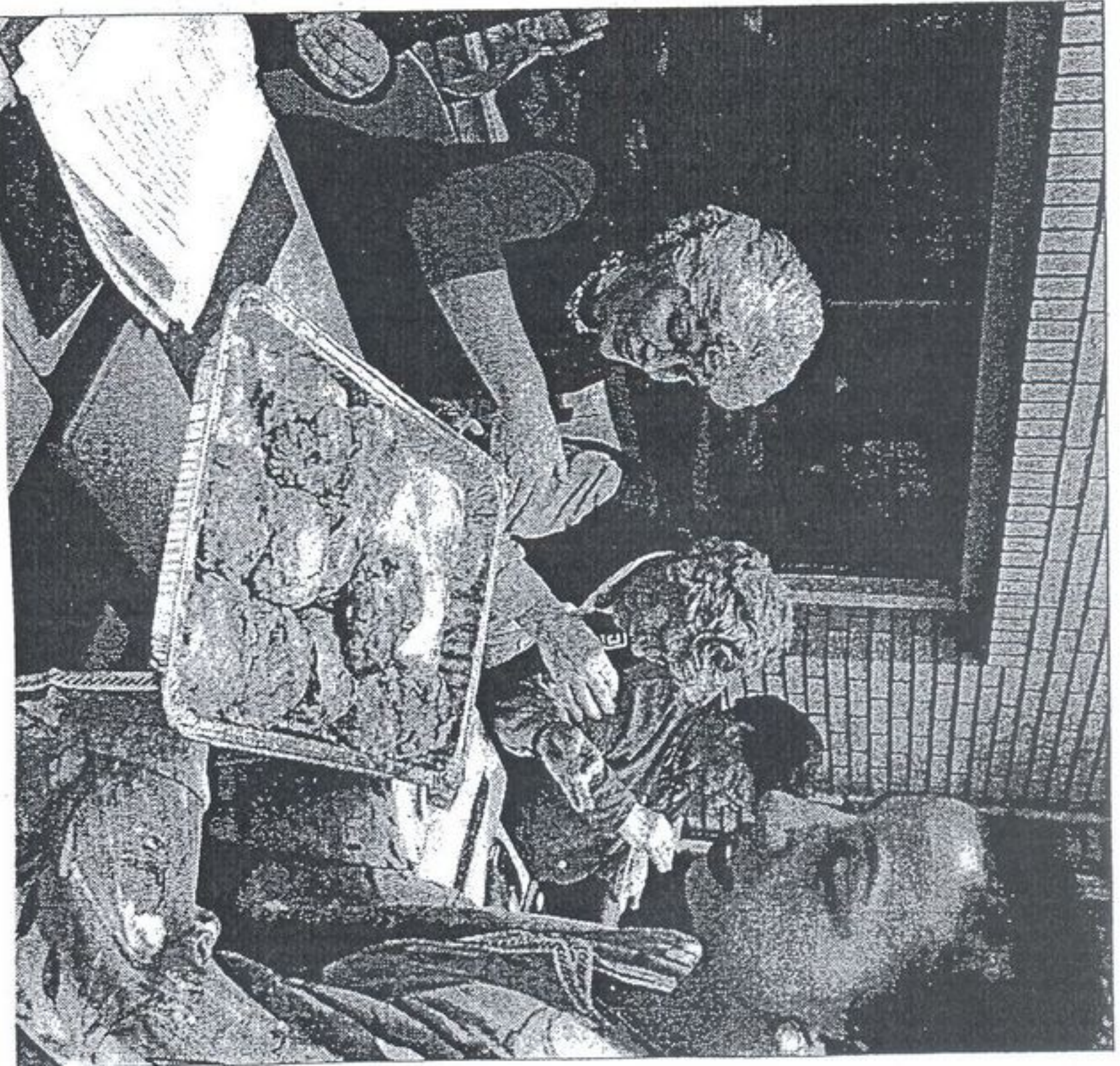
In Delft is de afgelopen weken een cursus 'Inburgeren andersom' gegeven, door Marokkanen voor Nederlanders. De animo voor de cursus was groot. De eerste inburgeringscursus voor Nederlanders door Marokkanen is een initiatief van de Delftse onderwijswethouder Rensen (PvdA). De cursus is ontstaan uit de gedachte dat nieuwkomers veel moeten doen om in te burgeren, maar dat inburgering ook van twee kanten moet komen. Op de foto wordt aan de deelnemers aan de cursus pastilla (bladerdeeg met kip, amandelen, ei, ui en kruiden) uitgedeeld.