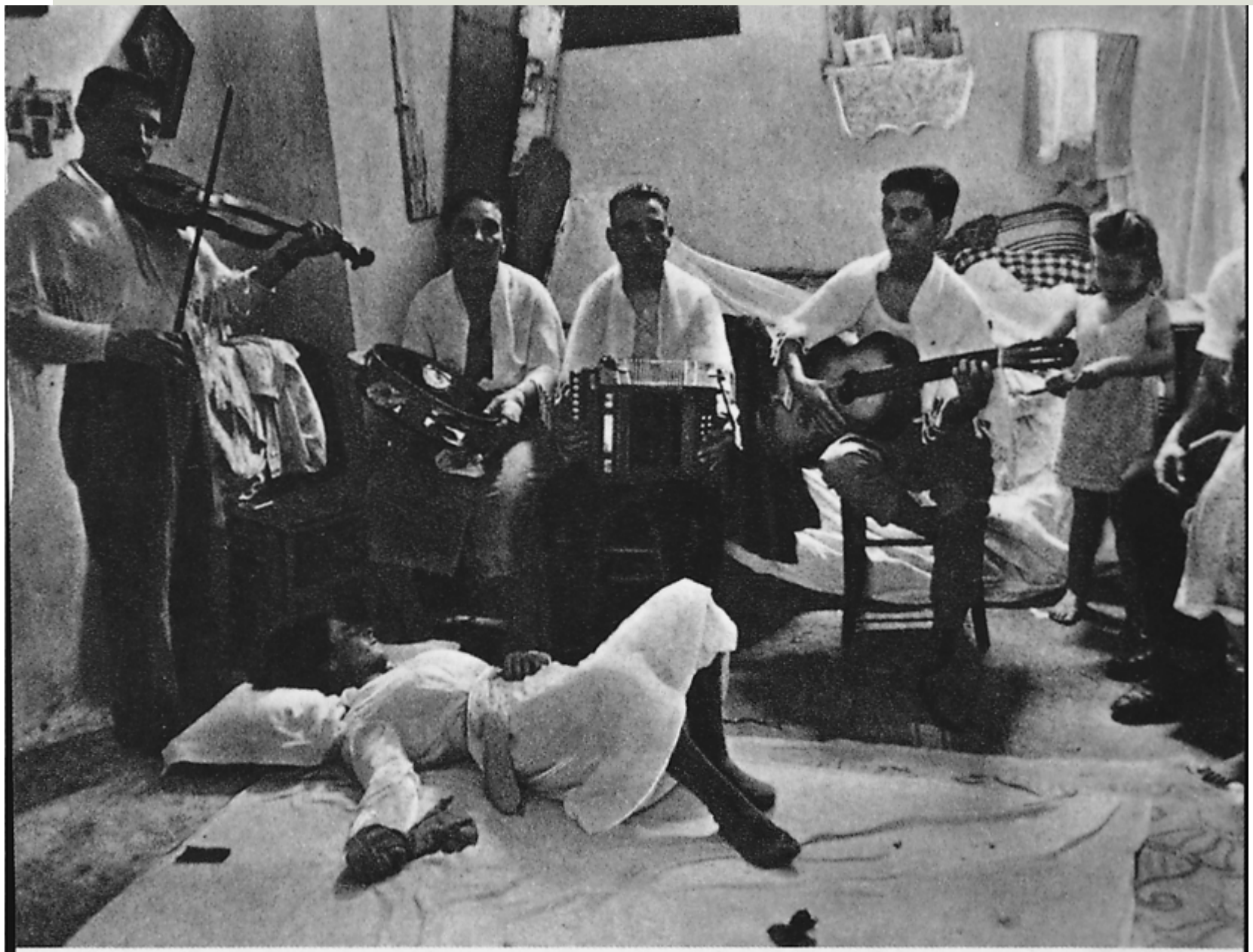
La Taranta, Mingozzi 1962