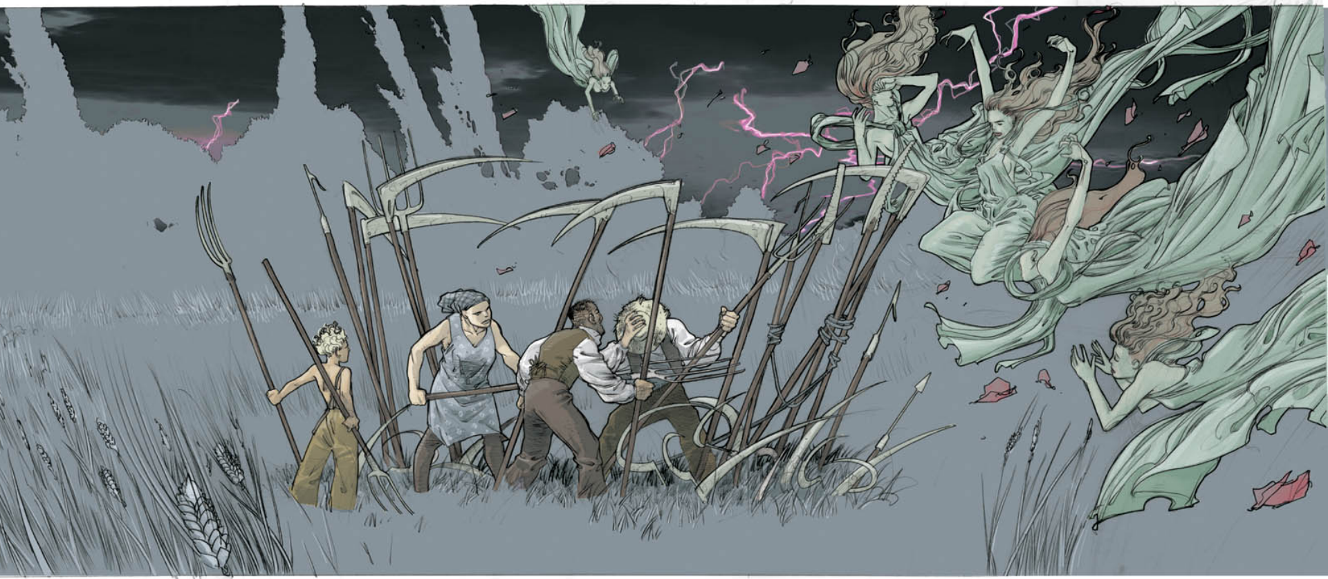
Jean Rouch, Le maître fous