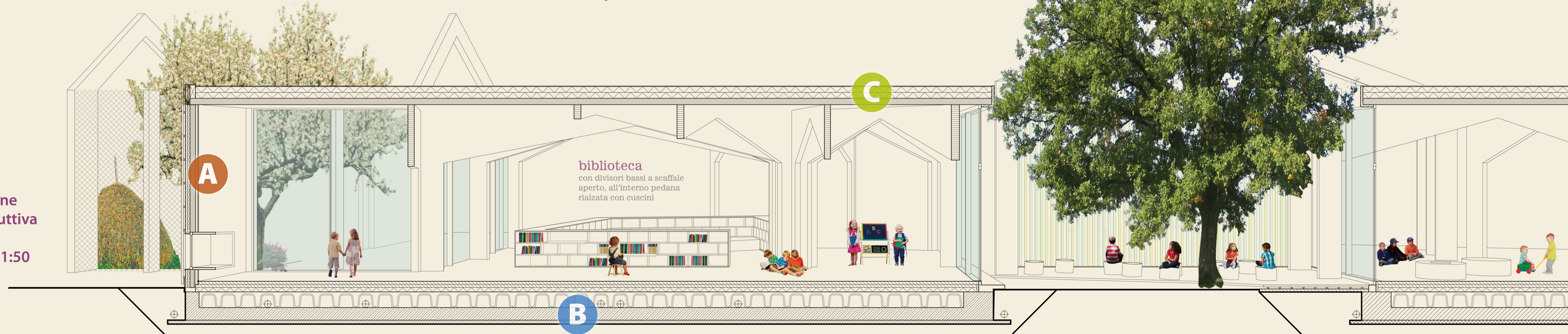
Sezione costruttiva C-C scala 1:50