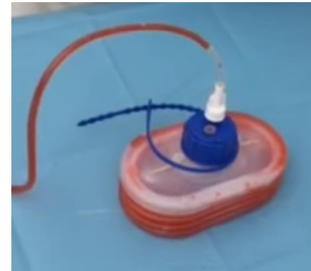
Vari tipi di drenaggio