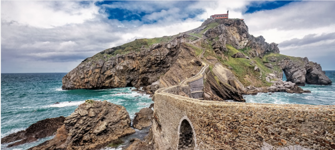
▲ SAN JUAN DE GAZTELUGATXE BERMEO (PAESI BASCHI)

Vuoi visitare il set del Trono di spade o quelli dove James Bond, Indiana Jones o Anakin Skywalker hanno vissuto le loro avventure? La Spagna è una delle mete del cinema e in molte città troverai itinerari legati alla settima arte. Scegli quello che fa per te.