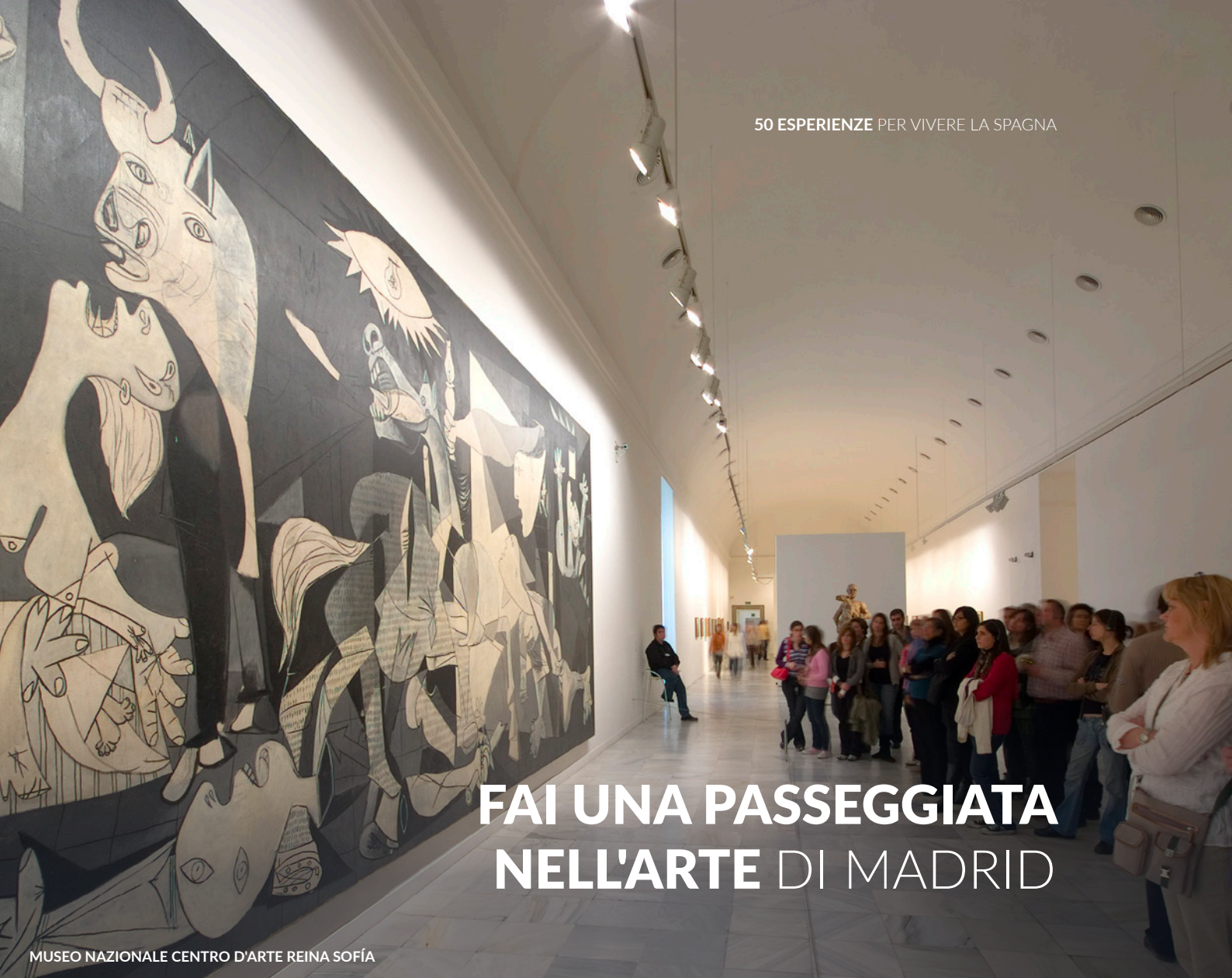
MUSEO NAZIONALE CENTRO D'ARTE REINA SOFÍA