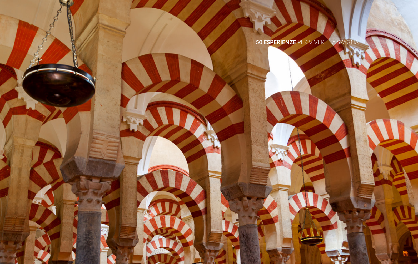
▲ MOSCHEA DI CORDOVA