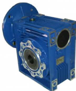
Reductor sin fin corona Tam. 30 B14-11