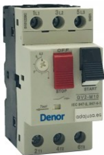
Interruttore salvamotore da 1,6 a 2,5 A.

I CLIENTI CHE HANNO ACQUISTATO QUESTO PRODOTTO HANNO COMPRATO ANCHE: