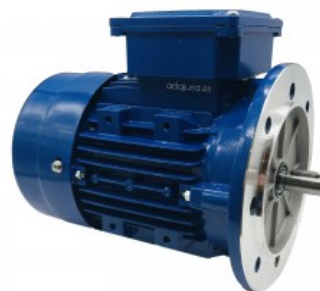
Motor trifasico 0,37Kw 0,5CV 230/400V 1500 rpm Brida B5