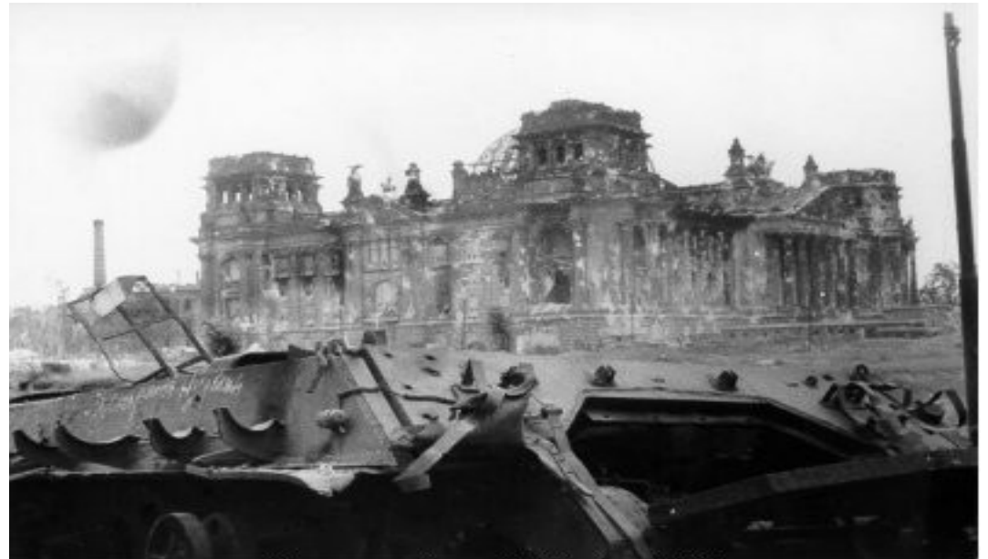
Panzerwrack am Reichstag, 1945