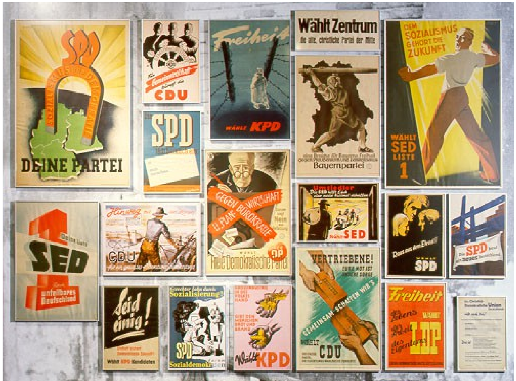
Wahlplakate der deutschen Parteien in den Besatzungszonen 1946/47