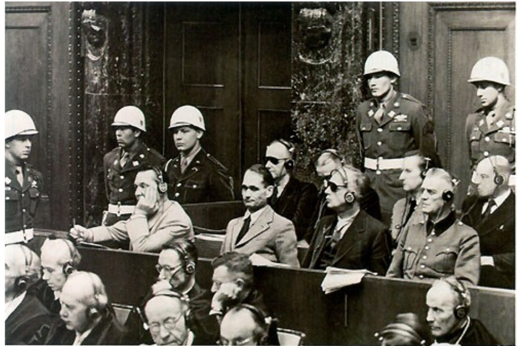
Die Anklagebank im Nürnberger Prozeß gegen die Hauptkriegsverbrecher vorne (v.l.n.r.): Hermann Göring, Rudolf Heß, Joachim von Ribbentrop, Wilhelm Keitel; hinten (v.l.n.r.): Karl Dönitz, Erich Raeder, Baldur von Schirach, Fritz Sauckel. Nürnberg, 1945/46