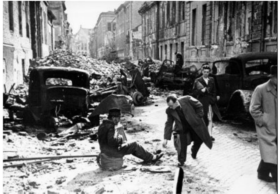
Zerstörte Berliner Innenstadt, 1945