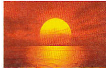
Die Sonne und das Meer am Abend