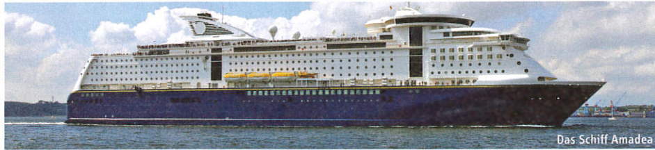
Das Schiff Amadea

► 1132 a Lesen Sie und hören Sie. Was finden tom1 und calypso gut, was finden sie schlecht? Schreiben Sie.