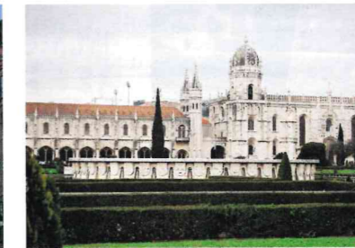
Mosteiro dos Jerónimos