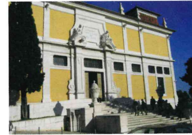
Museu de Arte Antiga