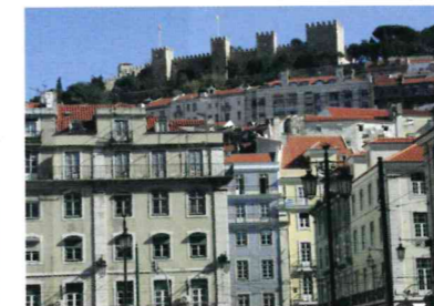
Castelo de S. Jorge