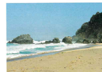
Praia da Adraga