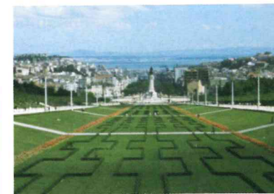
Parque Eduardo VII