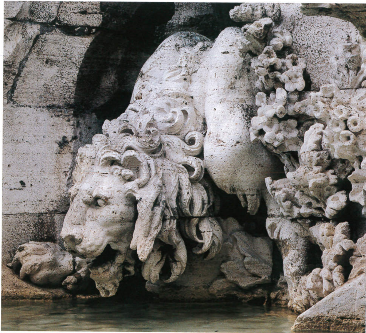
Nella pagina a fronte: Danubio .