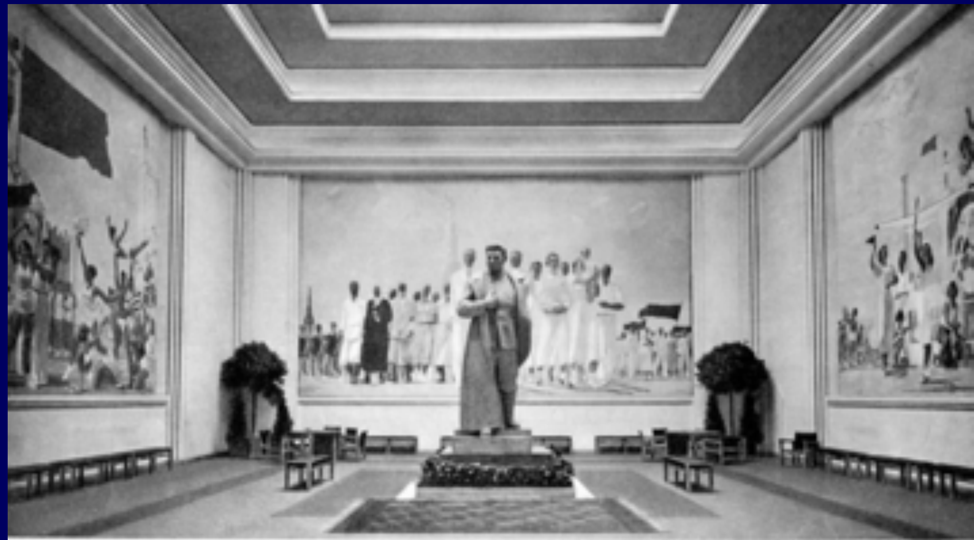
Le Salle finale du Pavillon - Statue de STALINE, par Merkurov