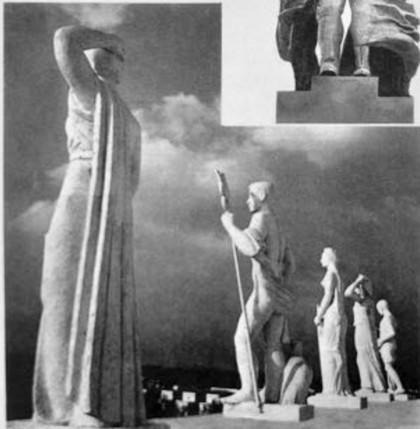
LES MOTIFS DE SCULPTURE QUI COURONNENT TROIS DES PRINCIPAUX PAVILLONS ETRANGERS

L'Allemagne (à gauche) - L'U.R.S.S. (au centre) - L'Angleterre (à droite)