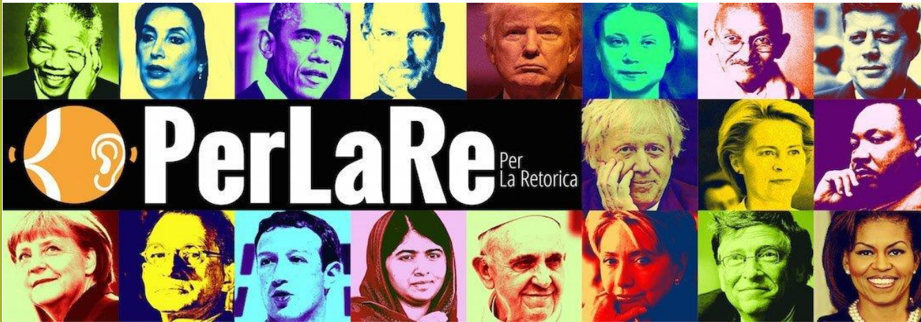
Figure retoriche e pubblicità: il paradosso