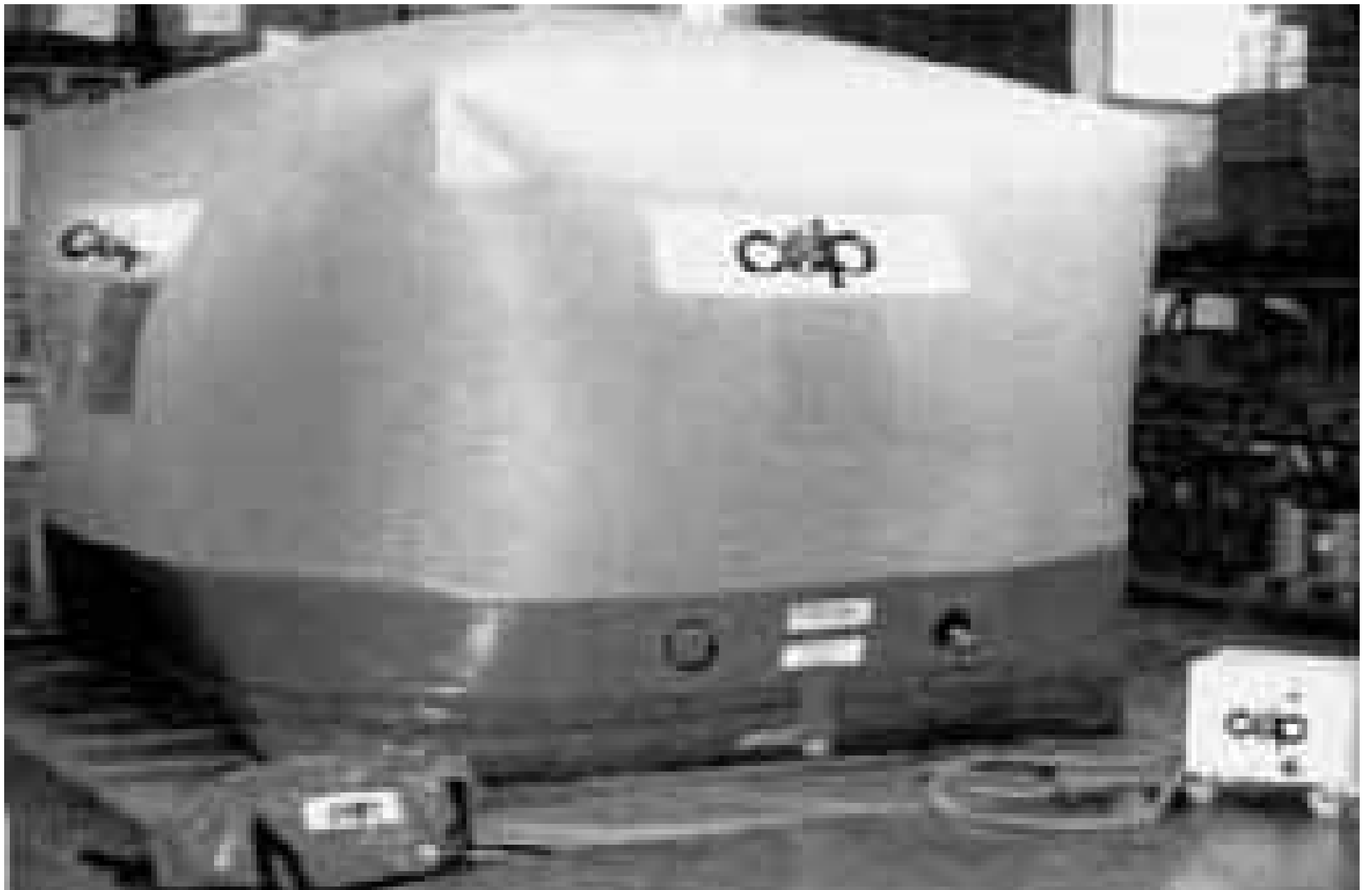
Figura 1 • Camera di fumigazione portatile.