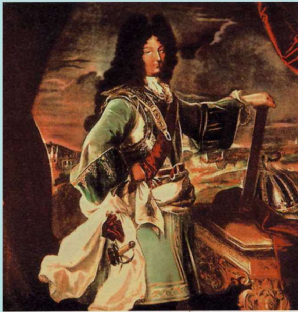
Luigi XIV, «Re Sole» (sul trono dal 1643-1715): “l’État c’est moi”

Fondamentale momento di passaggio: segnano il primato della legislazione tra le fonti del diritto