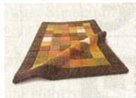
8 • Teppich