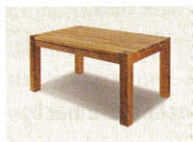
2 • _____