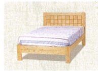
10 • Bett