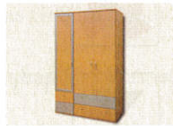
9 • _____