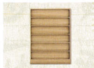
7 • Regal