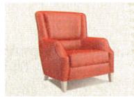
15 • Sessel