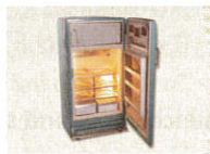
3 • _____