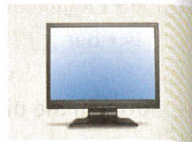
6 • _____