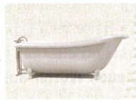
5 • Badewanne