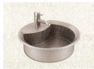
14 • Waschbecken