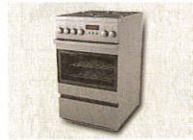
11 • Herd