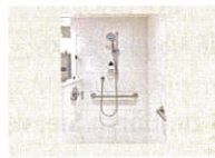
4 • Dusche