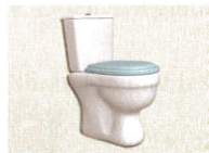
13 • Toilette