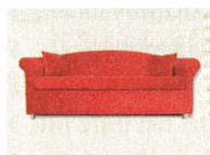
1 • Sofa

Fernseher Schrank Kühlschrank Tisch Stuhl