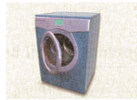
16 • Waschmaschine

b Wo sind Ihre Möbel/...? Ordnen Sie zu. Schreiben Sie.