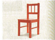
12 • _____