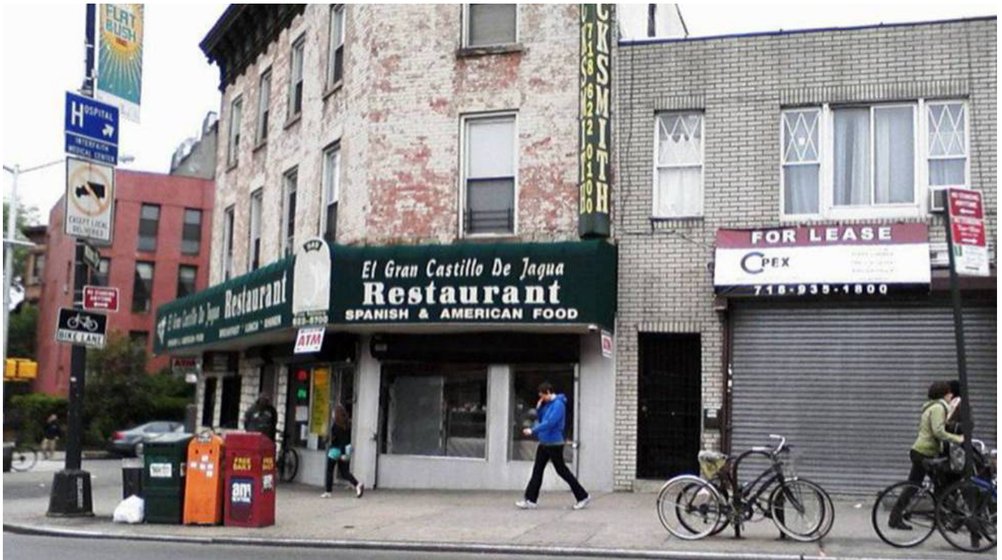
Calle de Nueva York con rótulos publicitarios en español. En vídeo, el acto en el Instituto Cervantes.

Madrid / Nueva York - 12 OCT 2019 - 17:47 CEST