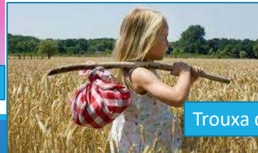
Trouxa de roupa