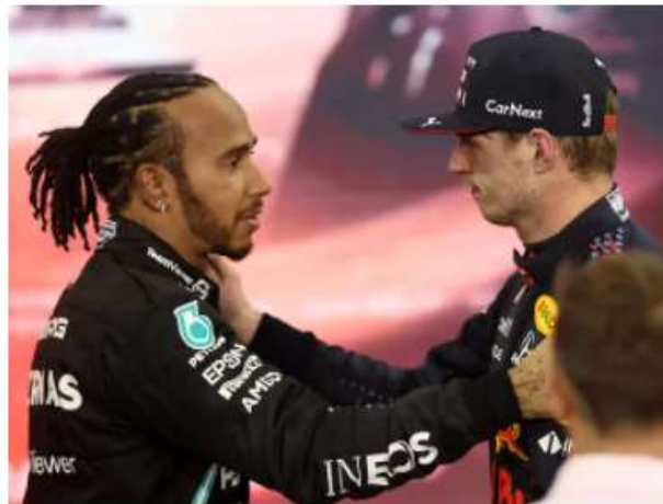
Inglês cumprimentou o rival logo após a corrida em Abu Dhabi

Da Redação BandSports 12/12/2021 • 12:16 - Atualizado em 12/12/2021 • 14:01