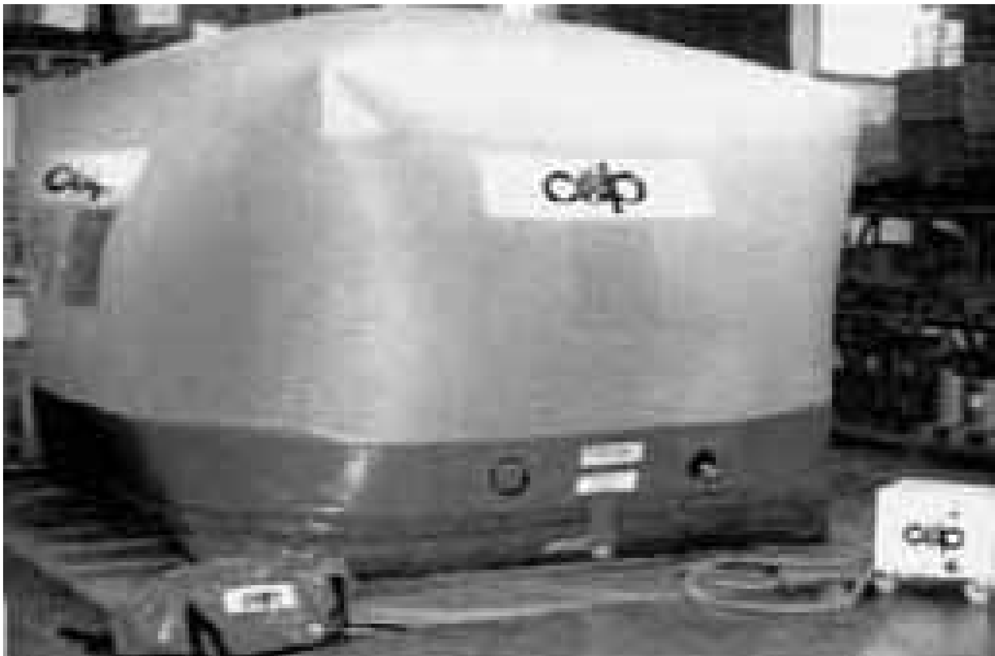
Figura 1 • Camera di fumigazione portatile.