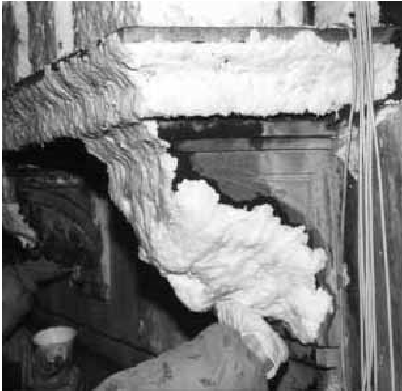
Figura 3 • Impacco in polpa di carta impregnata di biocida.