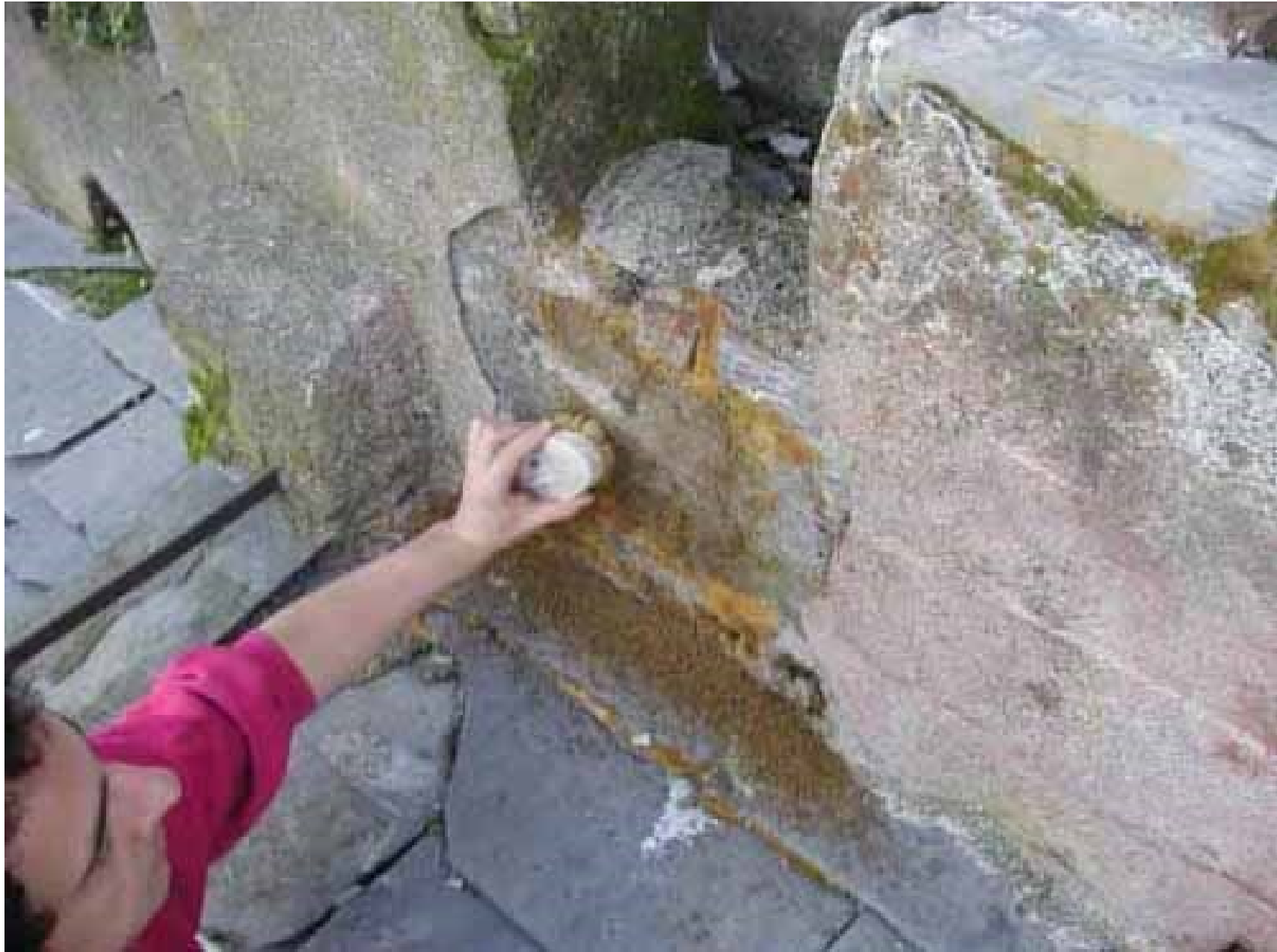
Figura 5 • Eliminazione della patina biologica secca, mediante spazzolatura.