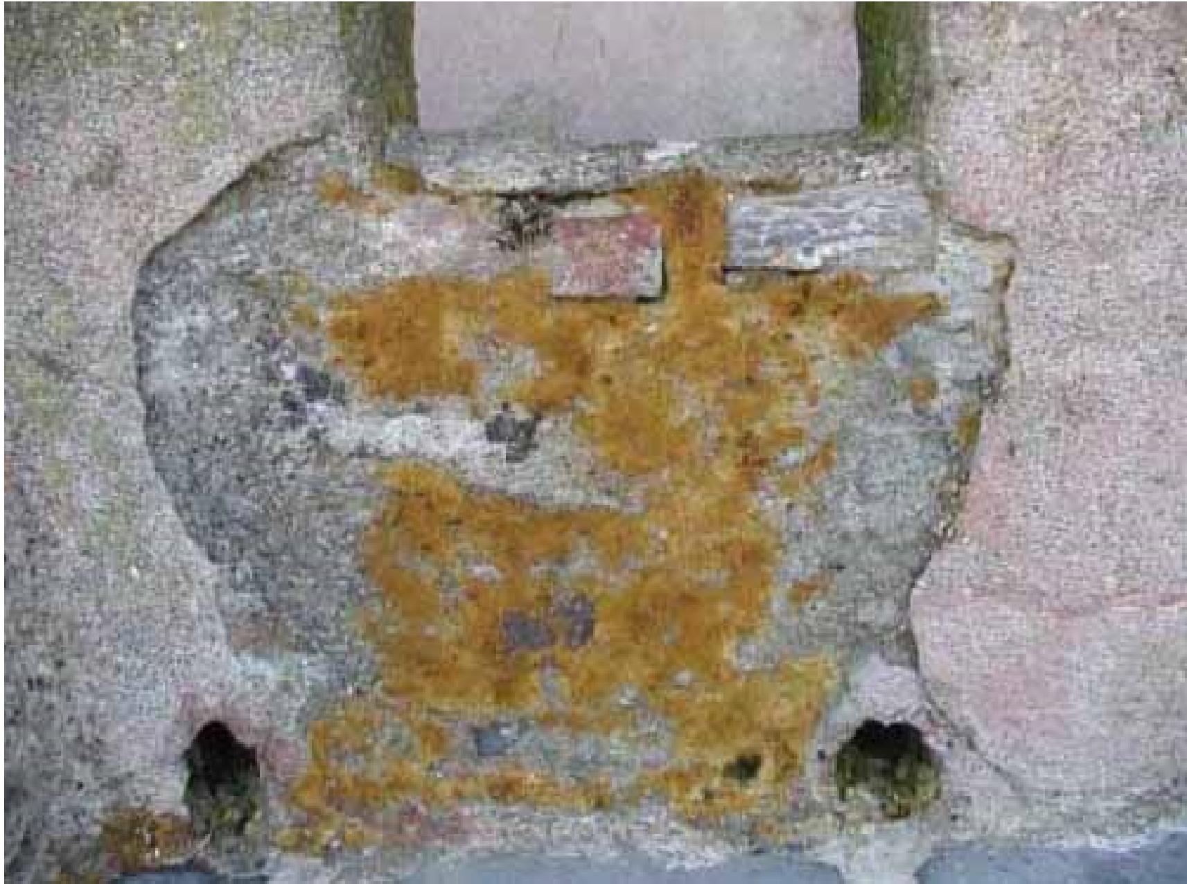
Figura 4 • Patina biologica dopo l'applicazione del disinfestante.