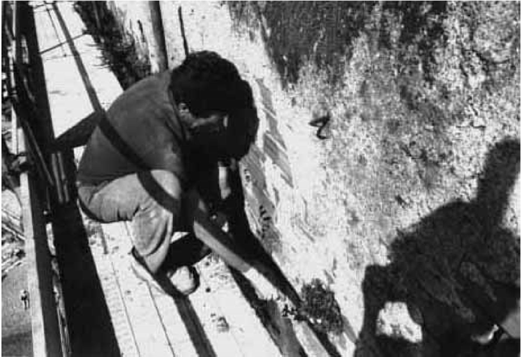
Figura 1 • Dopo l'applicazione di prodotto biocida l'operatore procede con l'estirpazione manuale della vegetazione infestante.