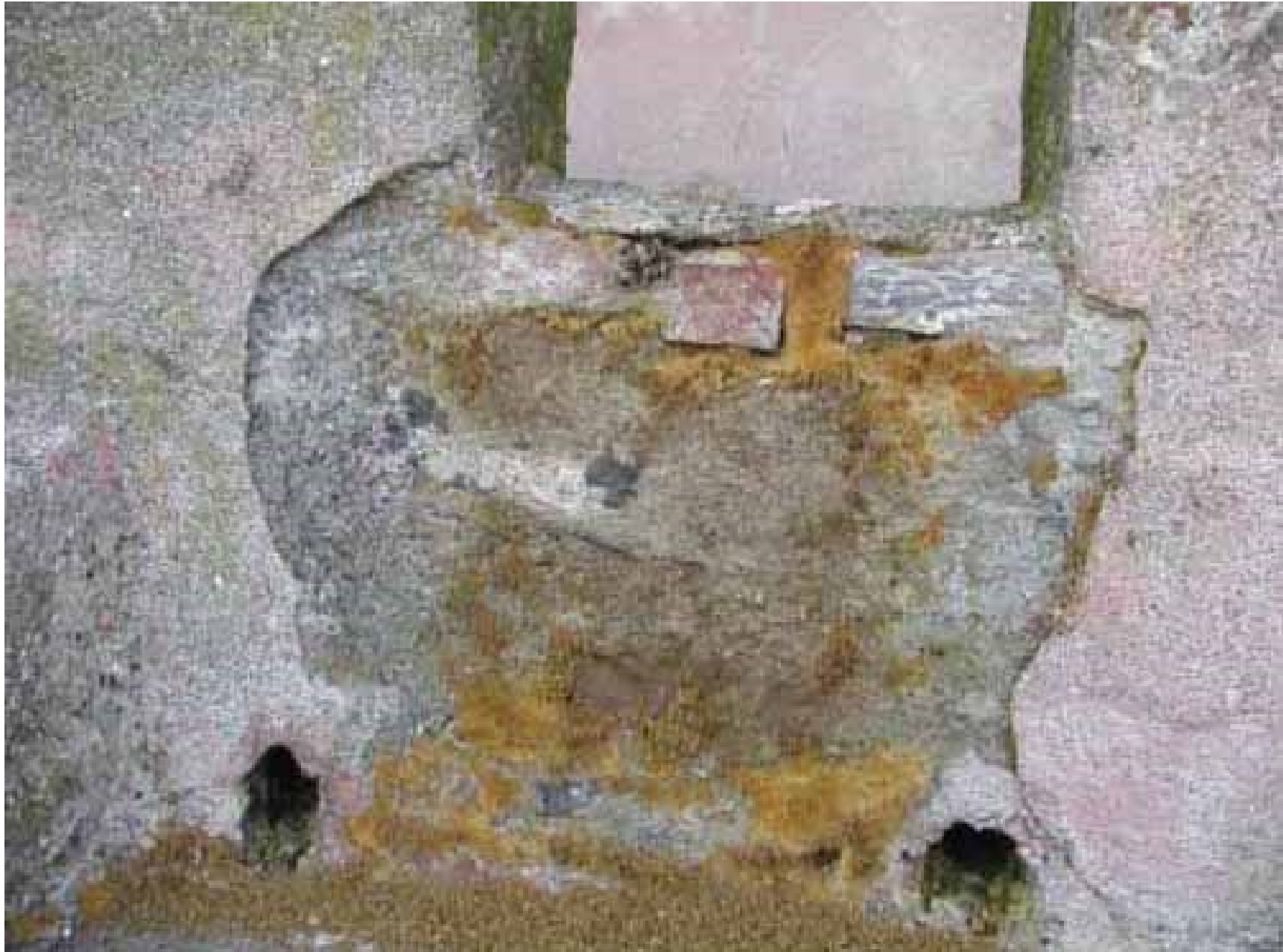
Figura 6 • Risultato parziale della disinfestazione.