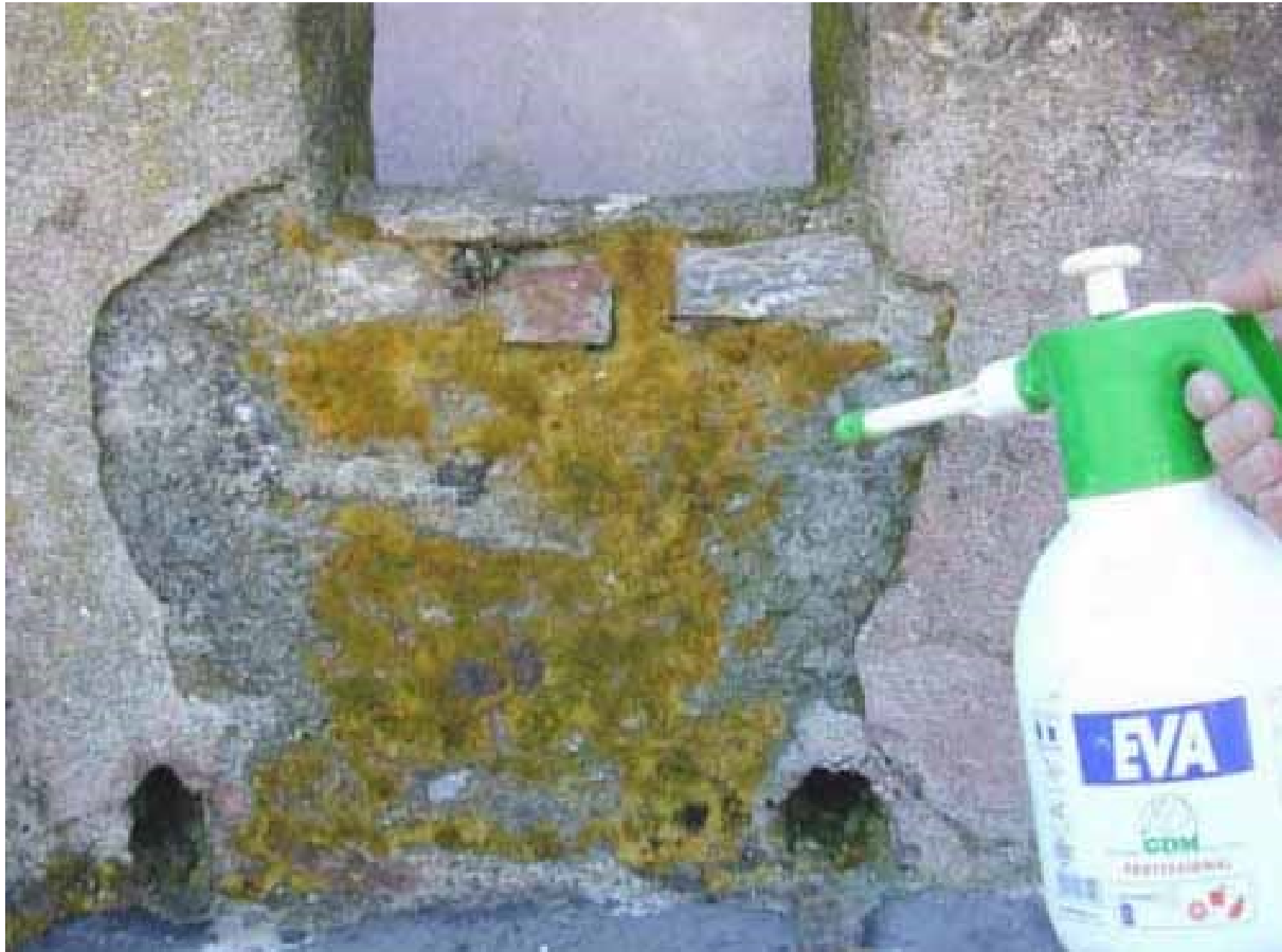
Figura 2 • Applicazione a spruzzo del liquido disinfestante.