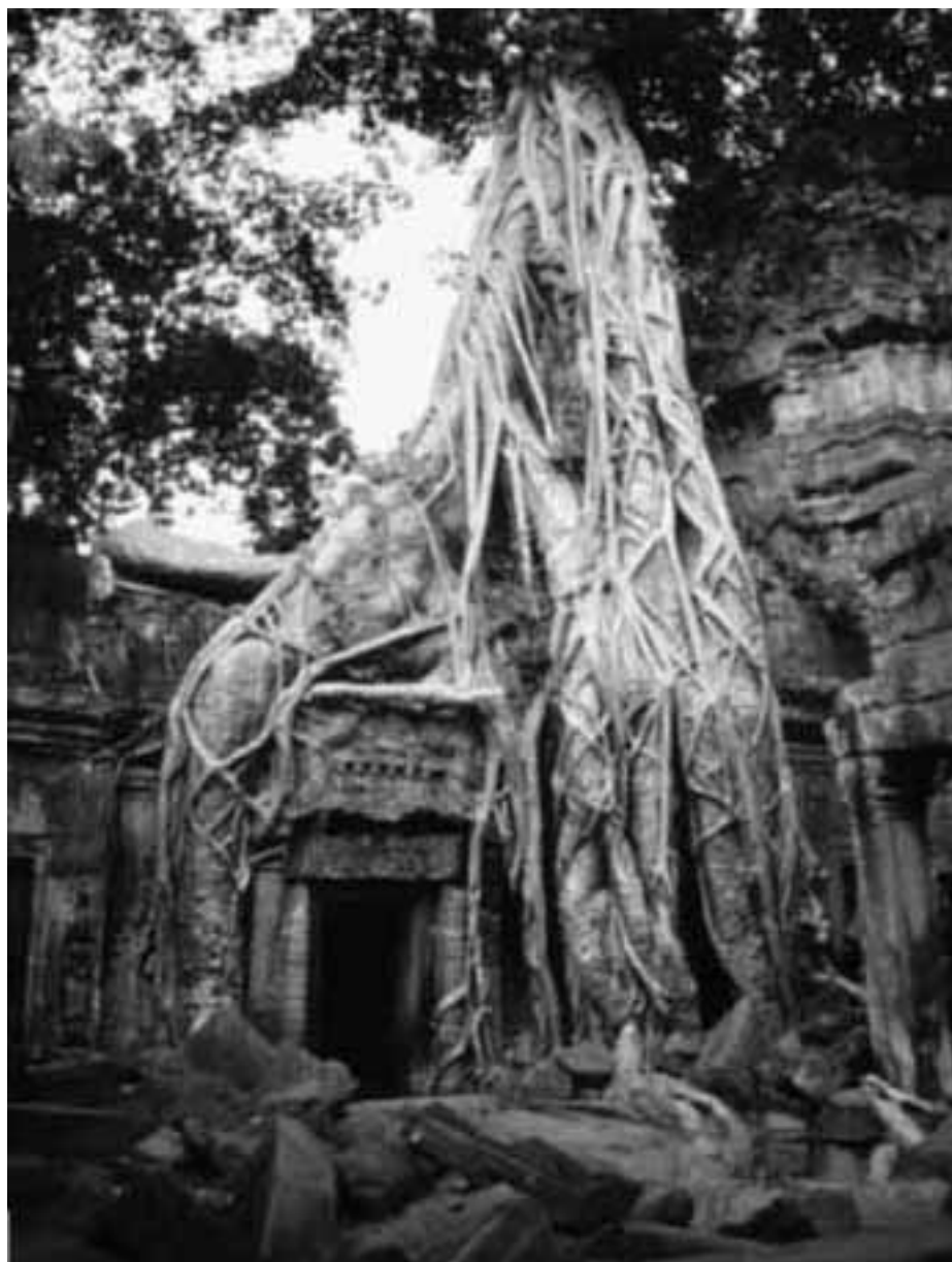
Figura 1 • Angkor (Cambogia), sito archeologico. Ta Prohm, unico complesso del sito mantenuto nelle condizioni in cui è stato scoperto.