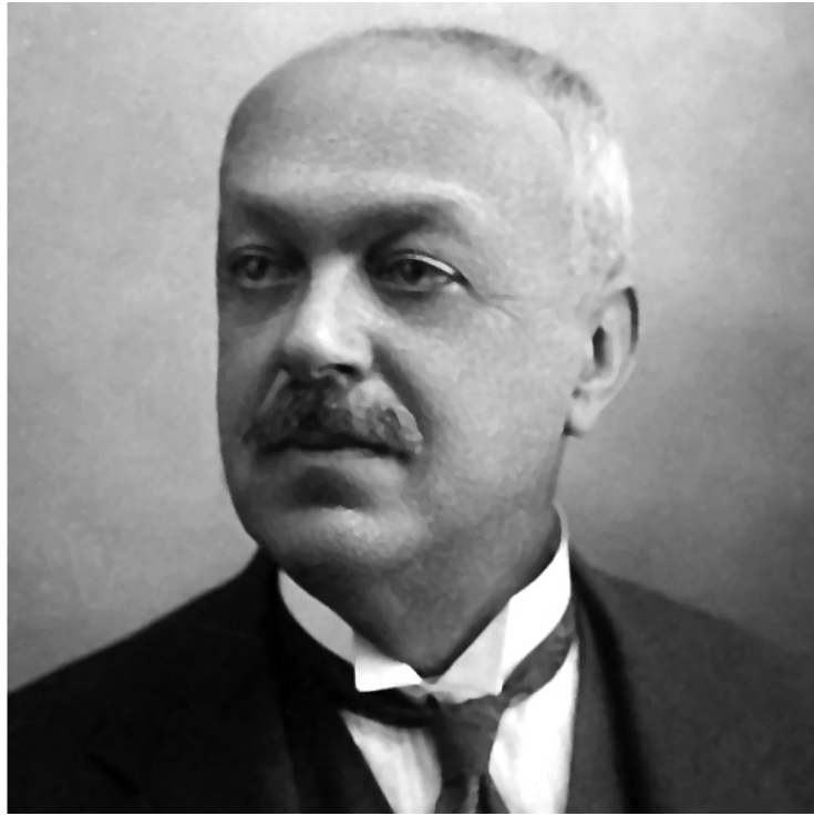
Italo Svevo, ca. 1928.