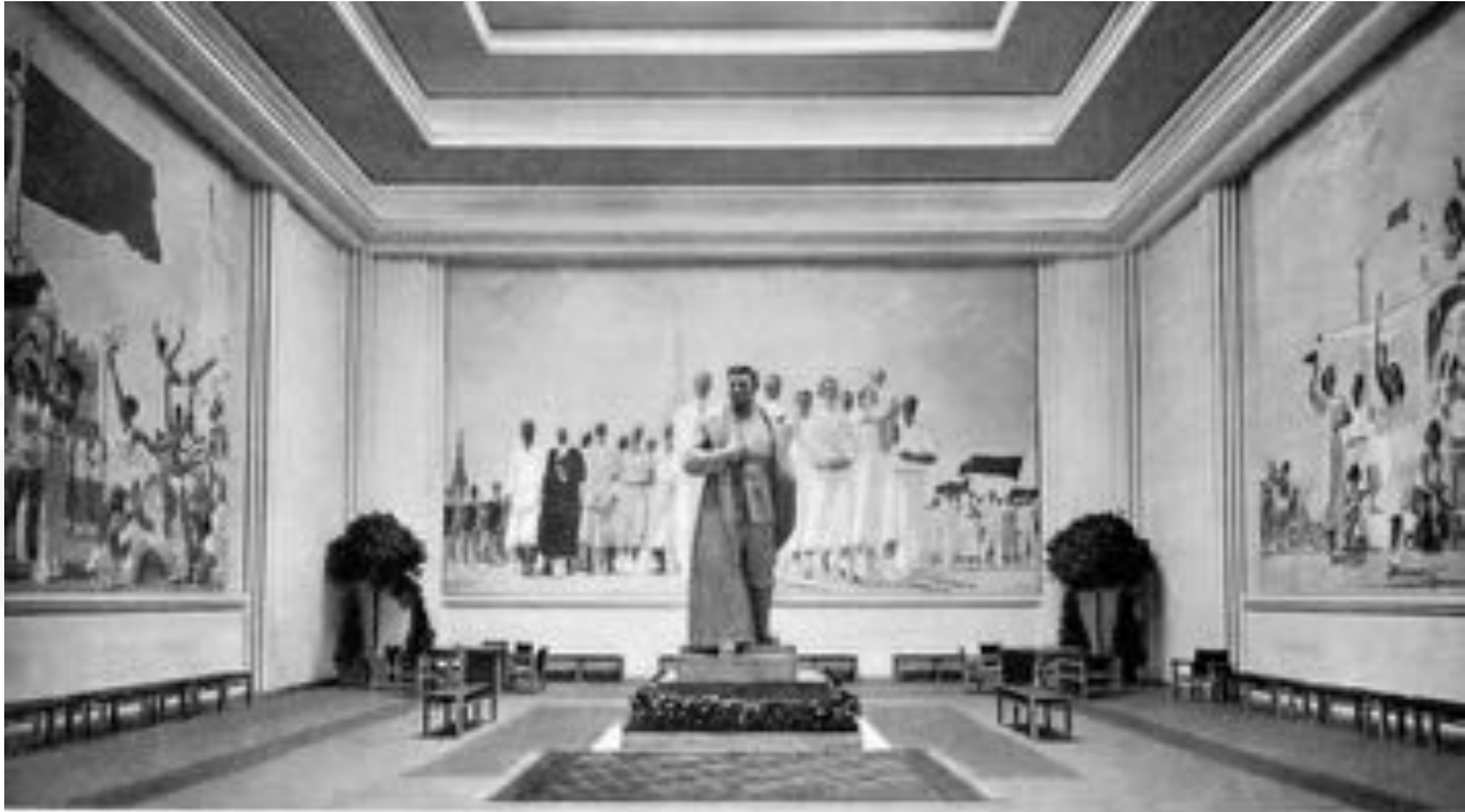
La Salle finale du Pavillon - Statue de STALINE, par Markov