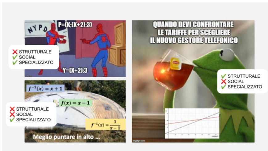
Figura 5. Controesempi

le regole del web implicate dai significati strutturale e social. In caso contrario, come accade nei controesempi della Figura 5, il messaggio del meme risulta indecifrabile per gli studenti.