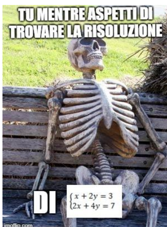
Figura 1. Un esempio di meme matematico.

Sebbene attualmente i meme siano poco esplorati dal punto di vista della didattica in generale (Knobel e Lankshear, 2007, 2019) e della didattica della matematica in particolare (Benoit, 2018; Bini e Robutti 2019a, 2019b), pensiamo che possano contribuire a diffondere una nuova cultura dell'apprendimento (Thomas e Seely Brown, 2011, Ito et al., 2013), sia se usati dall'insegnante per stimolare la discussione matematica, sia se sono gli studenti a creare le proprie versioni. I meme possono offrire agli studenti un ambiente meno formale, ma altrettanto significativo dal punto di vista matematico, per mostrare le loro conoscenze. In questo ambiente gli studenti possono dare prova di abilità non standard come la creatività, lo humour e la competenza nella cultura popolare. In Figura 1, un esempio di meme matematico creato durante una delle attività di sperimentazione, in cui si coglie bene come l'effetto umoristico sia accessibile solo a chi sa collegare il messaggio visivo con l'elaborazione del concetto matematico.