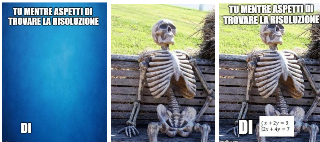
Figura 2a 2b 2c. I significati parziali di un meme.

Come secondo passo per avvicinarci ai meme, vogliamo fornire degli strumenti per coglierne appieno il messaggio: questo passaggio è fondamentale sia per capire i meme creati da altri che per essere in grado di creare i nostri. Per far ciò, facciamo riferimento a quello che Bini e Robutti (2019a) hanno chiamato il costrutto dei significati parziali , che utilizzeremo per analizzare il meme della Figura 1.