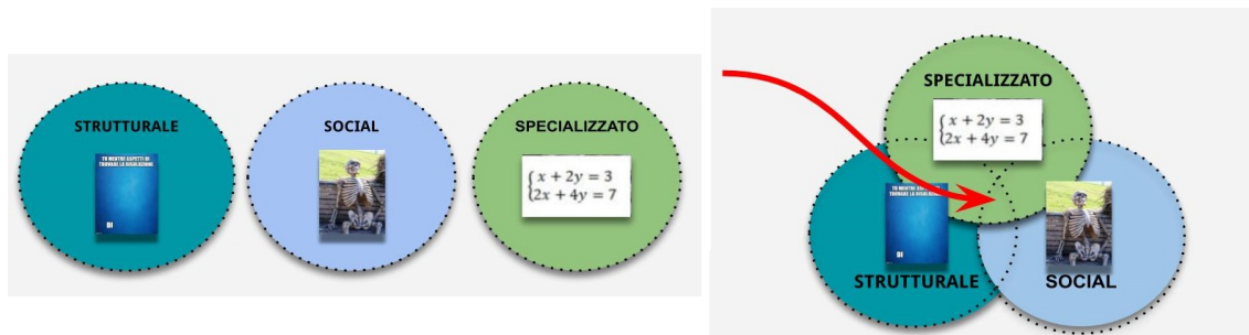
Figura 3. Il collegamento tra i significati parziali di un meme e il significato globale

Per capire il significato globale di un meme (e ridere della battuta) è necessario afferrare e saper collegare tra loro tutti e tre i significati parziali sopra descritti: se manca anche uno solo dei tre livelli, il messaggio complessivo non arriva a destinazione. Grazie alla loro quotidiana esposizione a questo tipo di artefatti, i giovani sono naturalmente abili nel decifrare i meme, a condizione che siano in possesso delle conoscenze specifiche implicite nel livello specializzato. Gli insegnanti, dal canto loro, non hanno sicuramente problemi con il significato specializzato, ma possono averne con quello strutturale o quello social, che gli studenti sono di regola ben contenti di spiegare: i meme possono così diventare una occasione per arricchire la dialettica studente/docente.