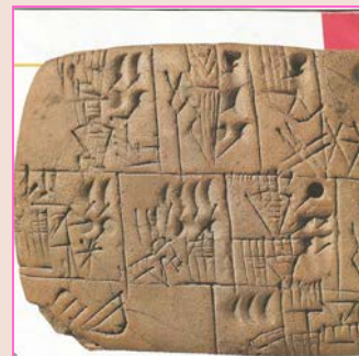
Tavoletta con esempio di scrittura cuneiforme.

L. De Luca, F. Gambino, R. Palazzeschi, Il tempo delle Idee. Storia e Geografia , 4, 2018