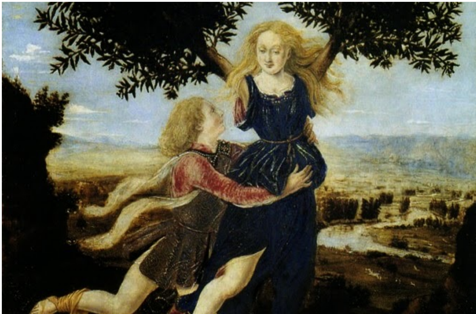
Apollo e Dafne (il Pollaiuolo)