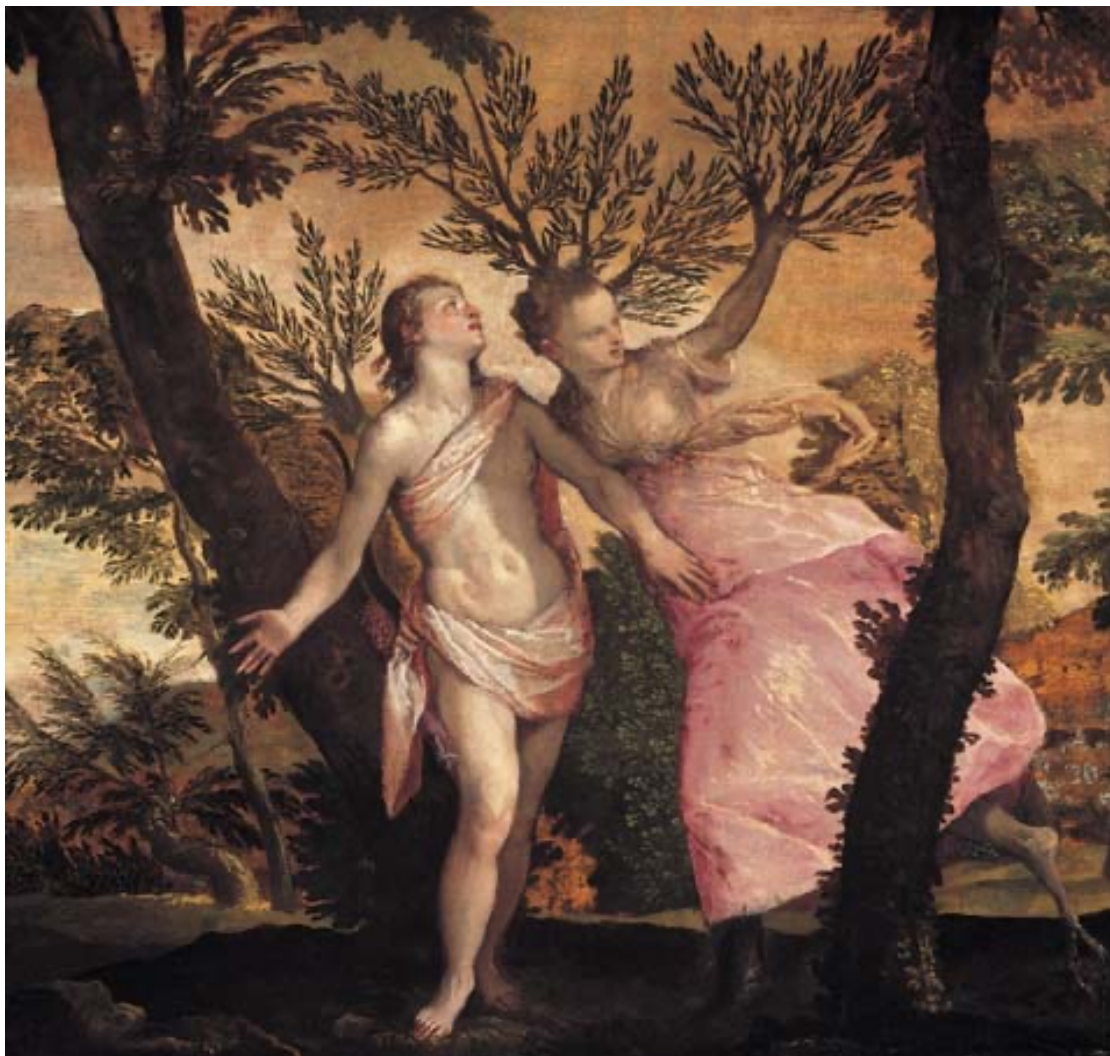
Apollo e Dafne (il Veronese)