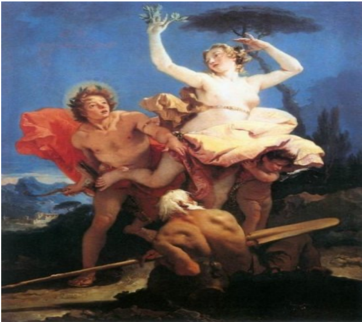
Apollo e Dafne (il Tiepolo)