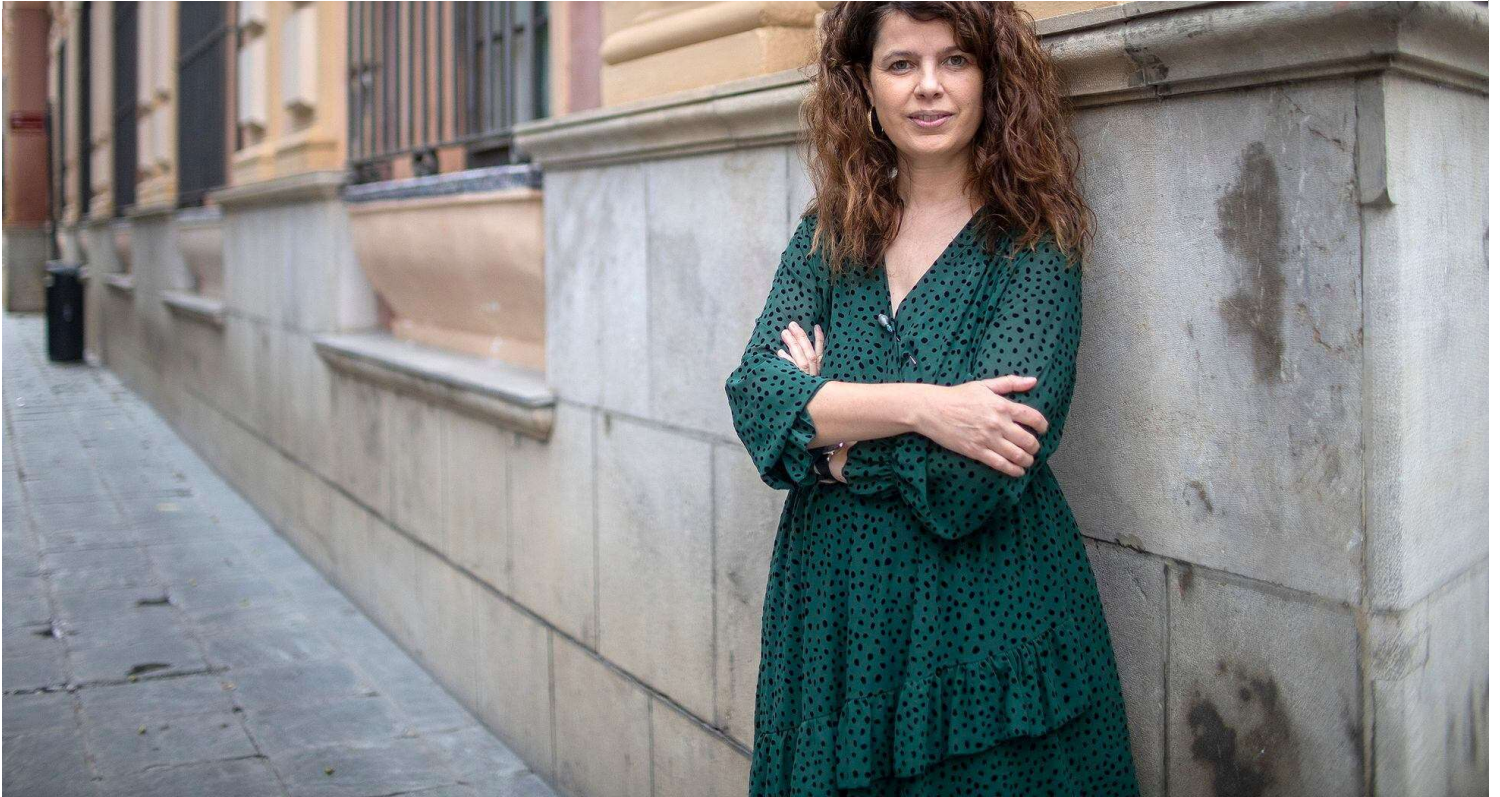
Lola Pons fotografiada en Sevilla el 23 de noviembre.