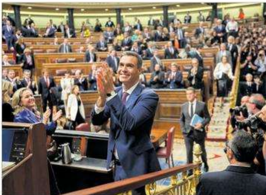
Pedro Sánchez, aplaudido tras confirmarse su elección, mientras Alberto Núñez Feijóo se acerca a él para felicitarlo.