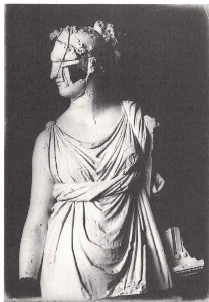
Antonio Canova, Terpsichore , gesso, 1814-16. Possagno, Gipsoteca.

EIDOS Rivista di Arti Letteratura e Musica Numero 4 Nuova Serie. Giugno 1989