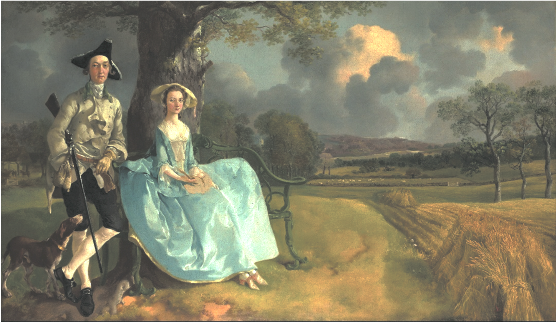
Mr and Mrs Andrews' di Thomas Gainsborough, 1750 circa, Londra, National Gallery