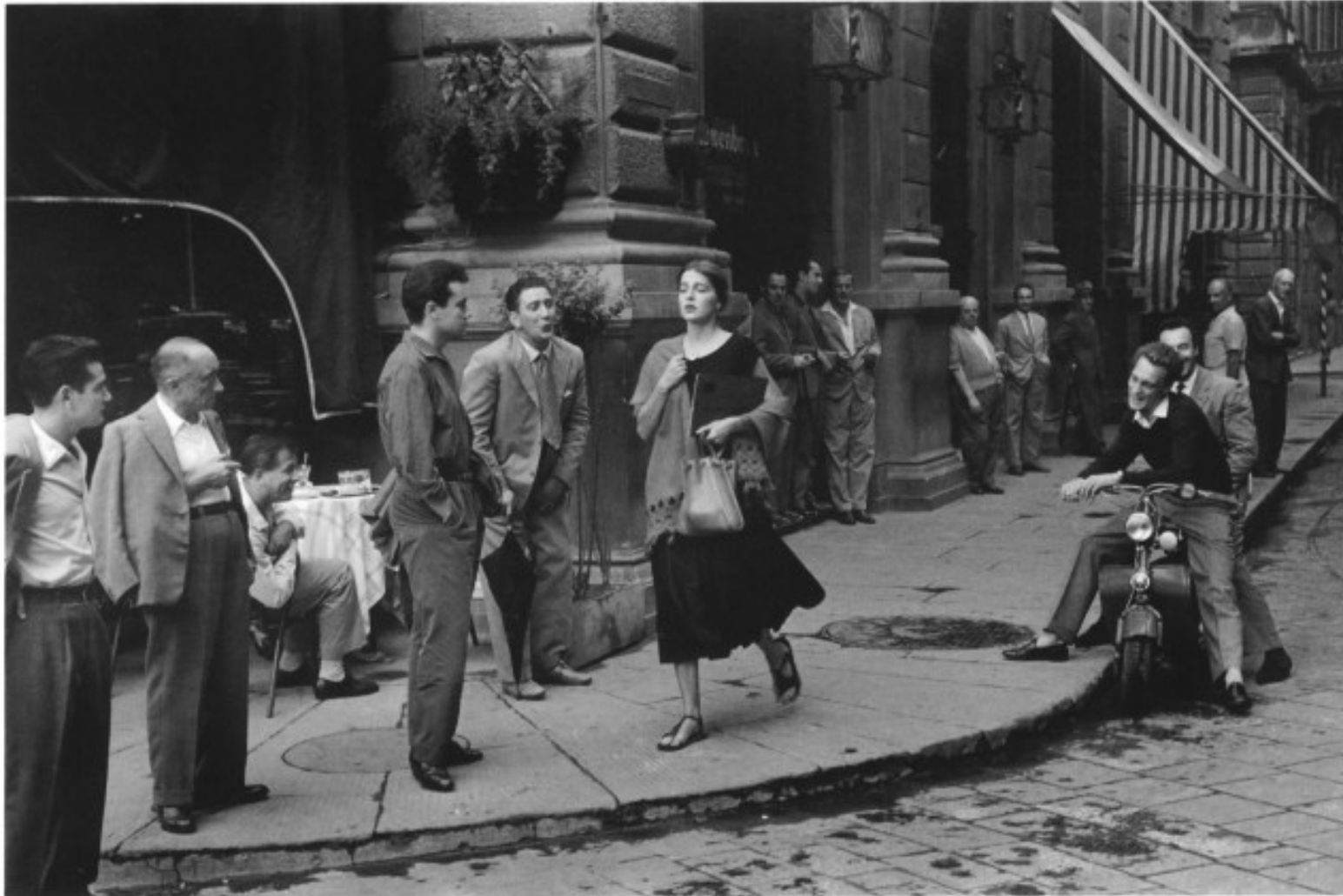
Mario De Biasi: American girl in Italy (anni 50)