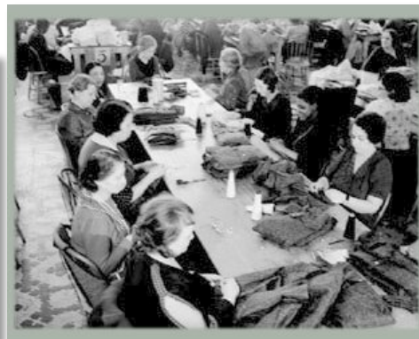
Campo lavorativo Mestieri