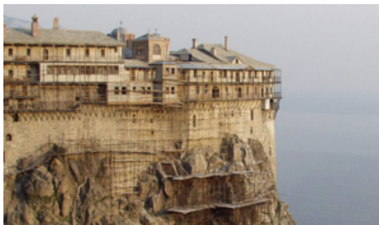
Luoghi religiosi Monasteri