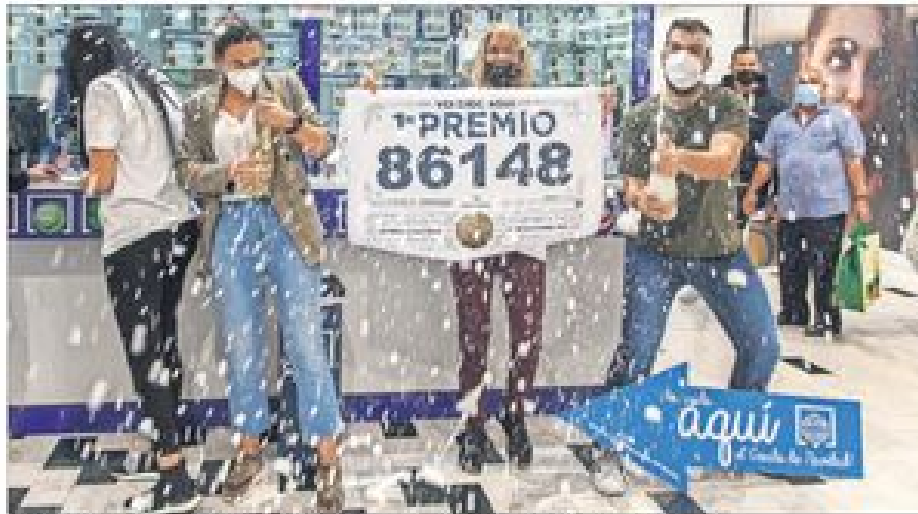
Celebración del Gordo en la administración del centro comercial El Mirador, en Las Palmas de Gran Canaria. 17

MIGUEL GONZÁLEZ, Madrid Las exportaciones españolas de armas alcanzaron los 1.633,9 millones de euros en la primera mitad del año, un aumento del 37,3% respecto al mismo periodo del año anterior, según el informe de la Secretaría de Estado de Comercio remitido al Congreso, al que tuvo acceso EL PAÍS. El 66,9% de las exportaciones de armas se dirigieron a socios de la OTAN. La mitad de las entregas de munición fueron a Arabia Saudí: 39,3 millones de euros. Palmas 18