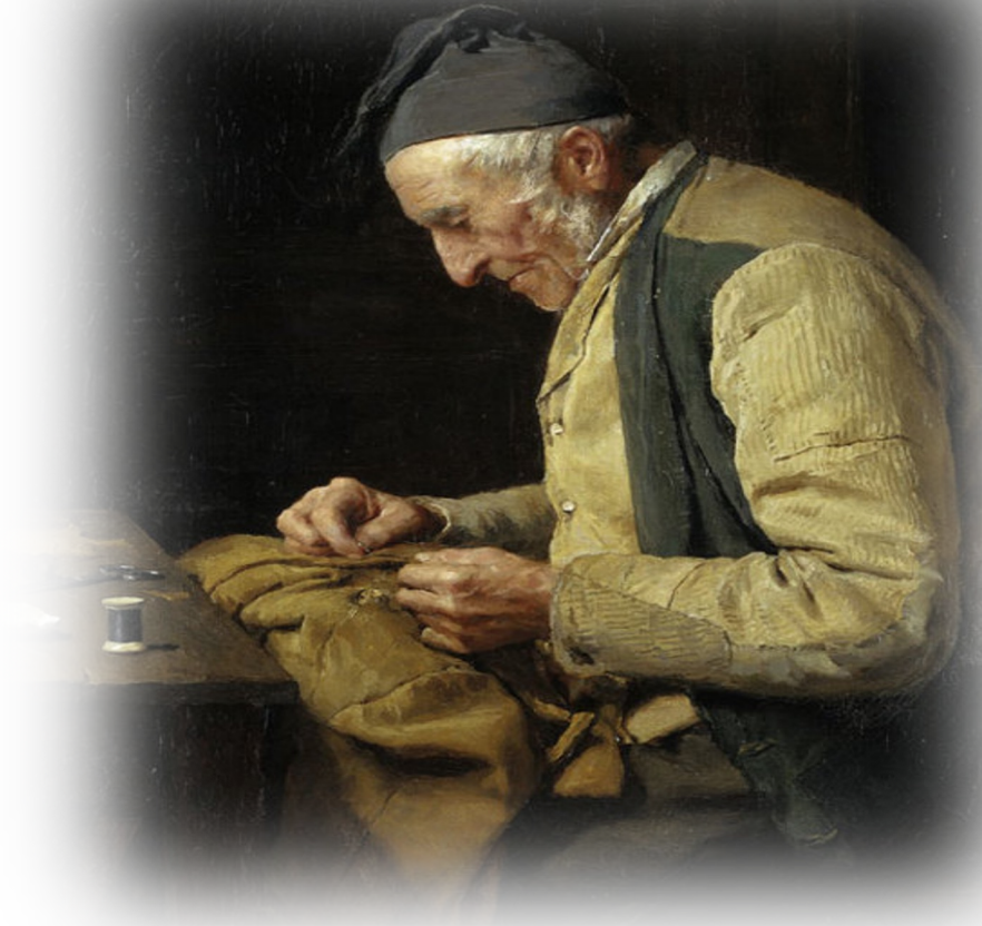
Albert Anker, Il sarto del villaggio (1894)