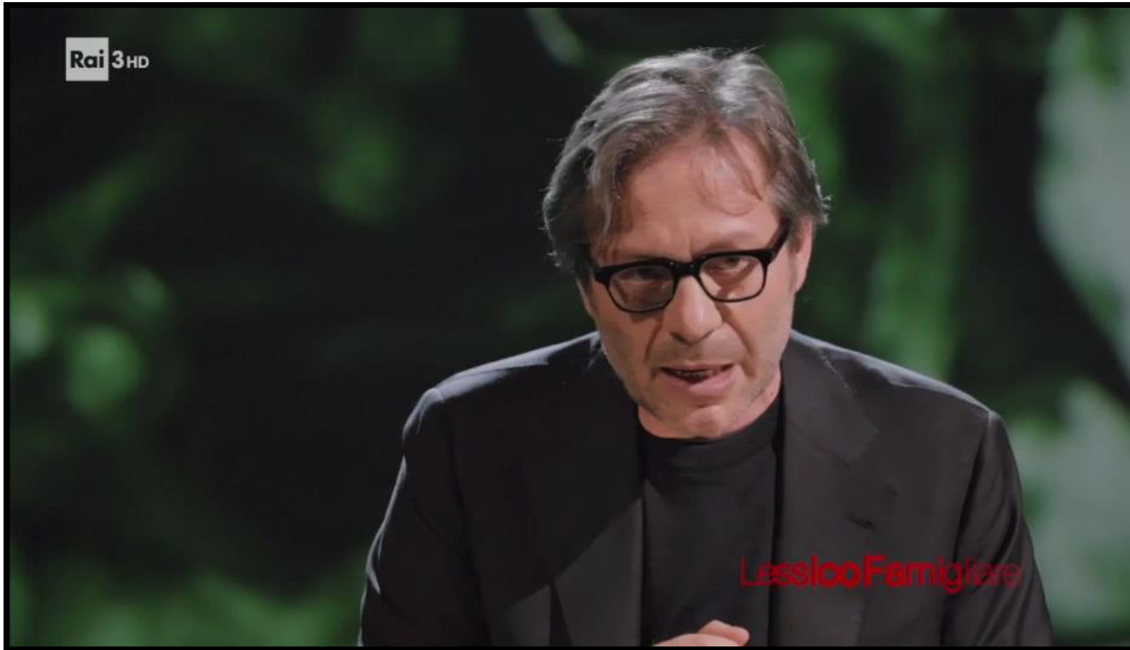
Massimo Recalcati, Lessico Familiare, La scuola, Rai 3, 2018