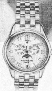
Annual Calendar by Patek Philippe

You never actually own a Patek Philippe. You merely take care of it for the next generation.