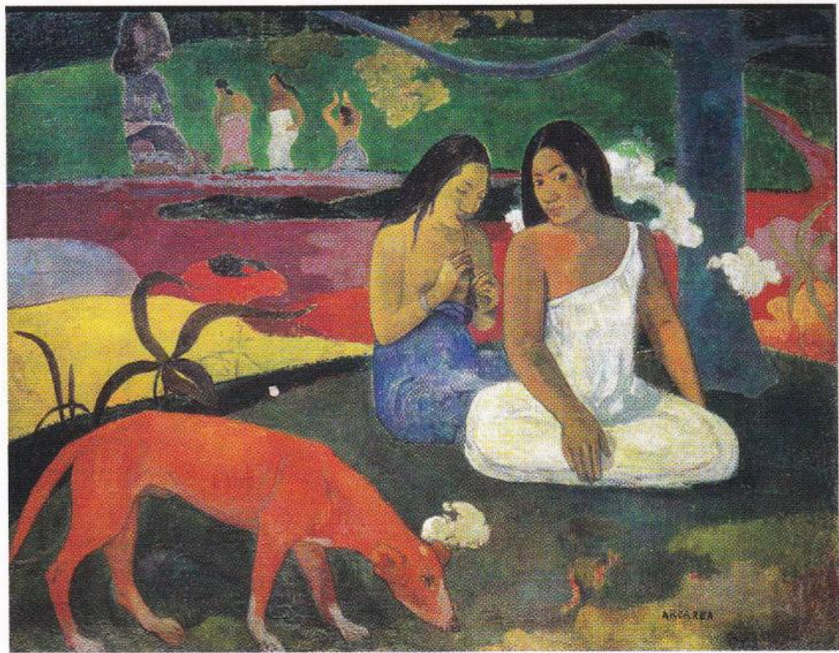
Paul Gauguin (1848-1903), Le chien rouge (ou Arearea) , 1892, huile sur toile.