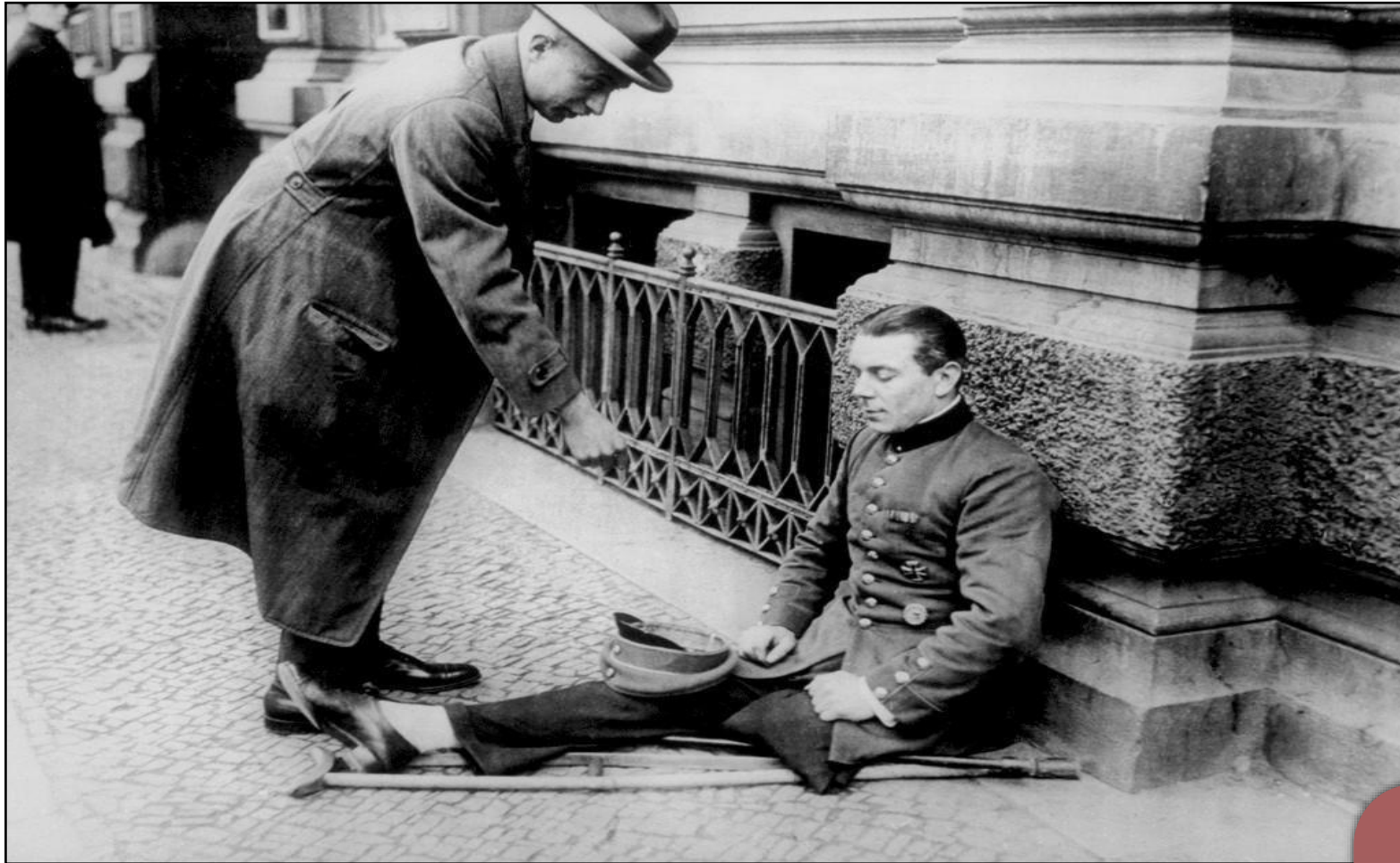
Un veterano invalido di guerra mendica in strada Berlino, 1923

Interventi per mutilati e invalidi di guerra in Gran Bretagna