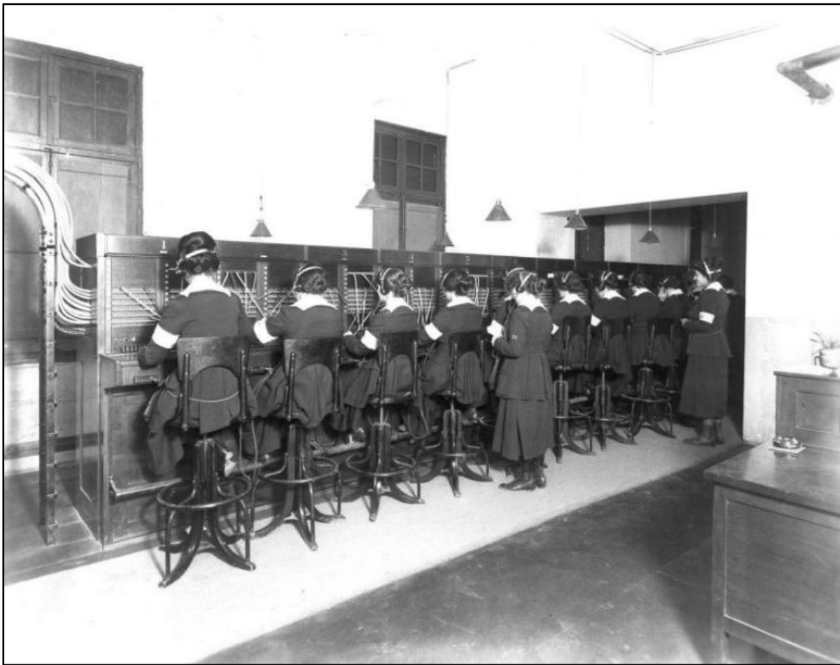
A sinistra: centraliniste US Army