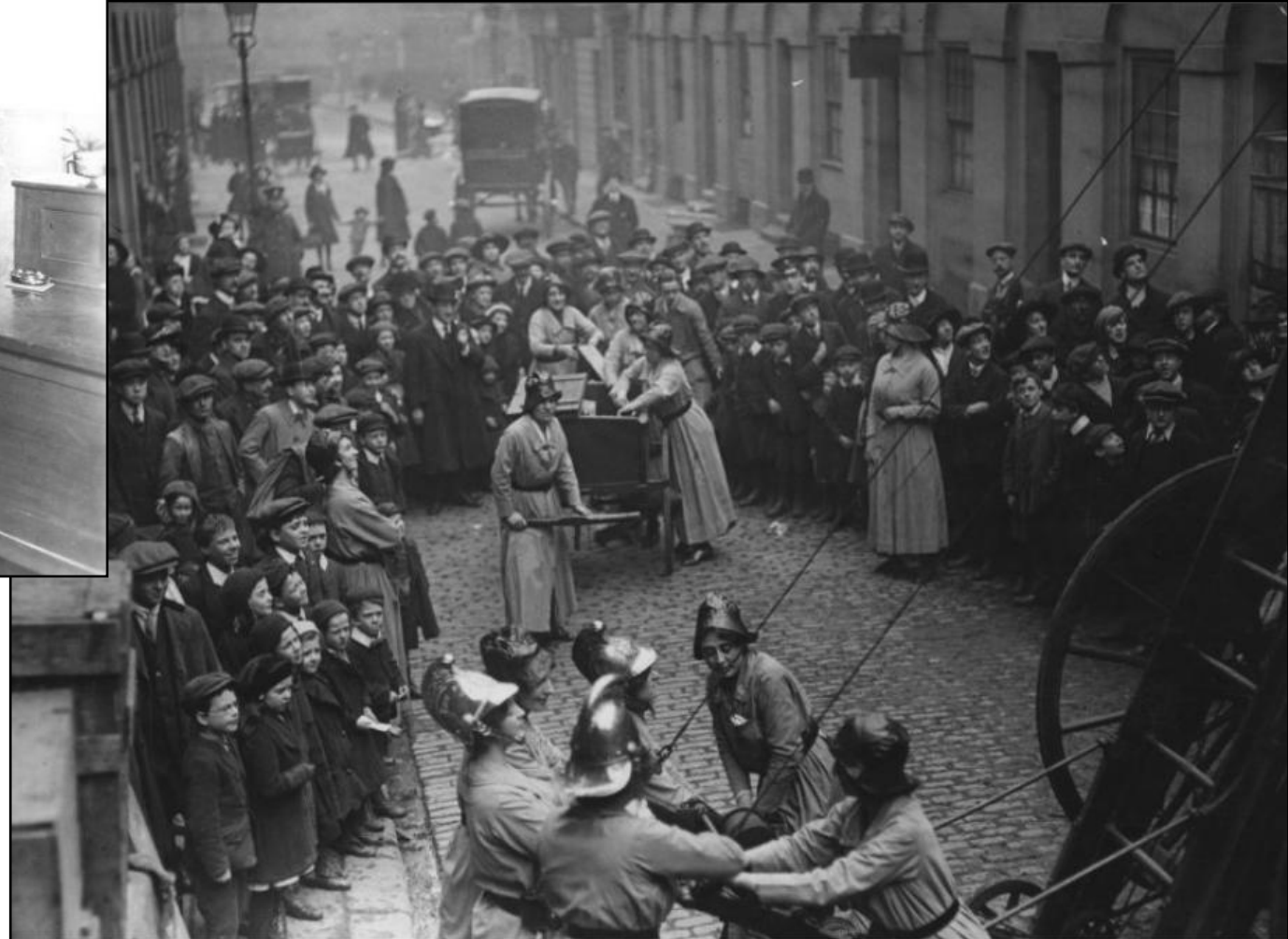
A destra: donne vigili del fuoco, GB