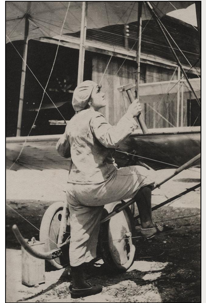
Meccanica aeronautica francese