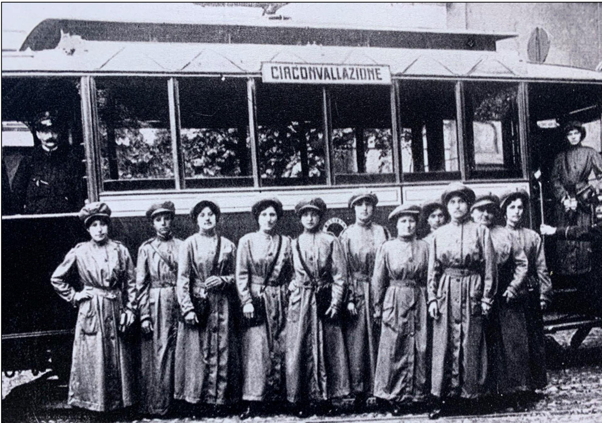
Guidatrici di tram, Roma, 1 guerra mondiale