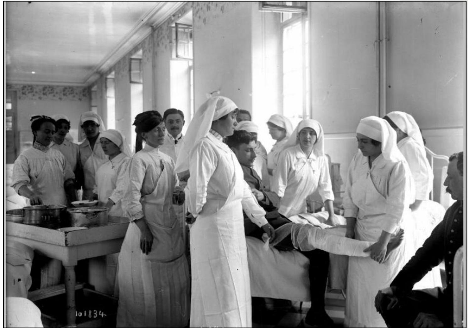
Infermiere, Francia, 1915