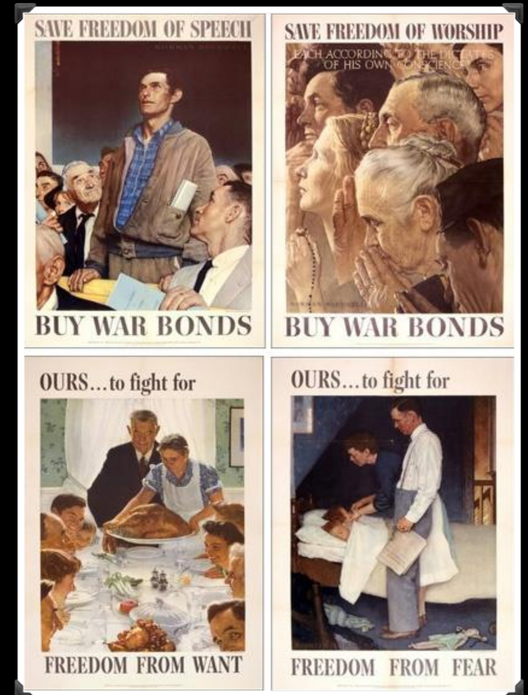
Norman Rockwell, «Four Freedoms» (1943)