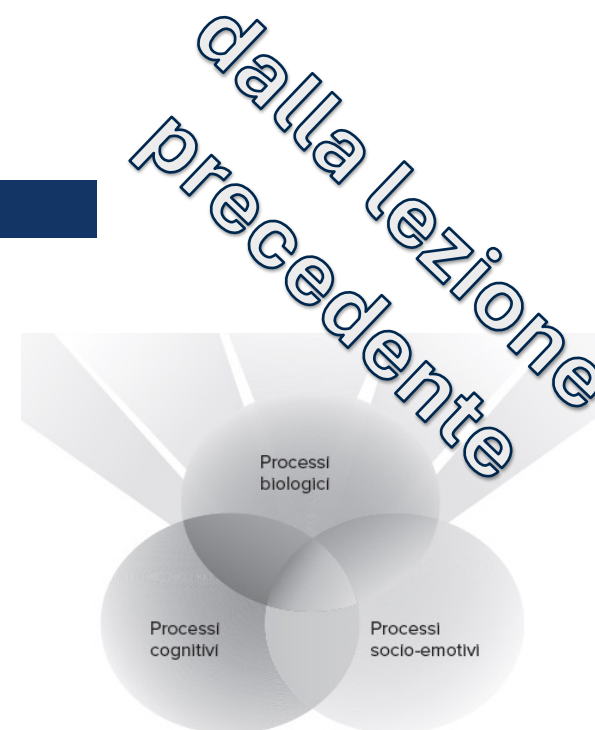
Immagine tratta da Santrock, 2021, 30 (trad. it.)

La pedagogia, l'educazione, secondo l'approccio delle capacità innate del soggetto , riconosce il valore di ciascuno nello sviluppare le proprie capacità e potenzialità; l'educatore/insegnante si preoccupa di facilitare gli eventi spontanei e naturali , di mettere in movimento ed esercitare le potenzialità già presenti nell'individuo, seppure nascoste.