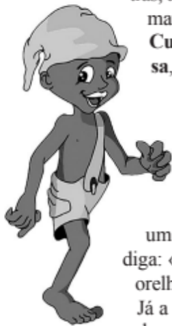
O Saci-Pererê

tras, à flora e à fauna da região. Entre as lendas mais populares podemos citar: o Boitatá, o Curupira, o Saci-Pererê, o Boto cor-de-rosa, a Iara, o Lobisomem, a Mula sem cabeça, o Negrinho do pastoreio, o Açaí, o Guaraná, a Mandioca, a Vitória-régia. Mas nem só de lendas vive o país: superstições, crendices e simpatias dão um toque original à cultura. Se você é supersticioso e quer evitar um evento ruim, bata na madeira três vezes e diga: «isola»; coceira na mão esquerda significa dinheiro à vista, mas se o negócio é orelha vermelha e quente, então cuidado, porque alguém está falando mal de você! Já a simpatia é um “ritual supersticioso para conseguir o que se deseja”. Faz parte dos costumes e tradições do povo brasileiro.