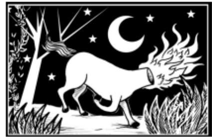
Mula sem cabeça

Há simpatias para o amor, para o trabalho, para a saúde, para o estudo, para afastar rivalidades ou inveja, para ter sorte, para ter dinheiro e para tantas outras situações. Ela pode se limitar a uma simples oração ao anjo da guarda, à leitura de um salmo da Bíblia, ou, então, ser a feitura de uma receita. Por exemplo, para descobrir o nome do futuro namorado, no dia 23 de junho, véspera de São João, espete uma faca no caule de uma bananeira. No dia seguinte, ao retirá-la, encontrará a inicial do nome do futuro namorado. Agora, para adoçar uma pessoa que está sempre de mau humor, escreva o seu nome em um pedaço de papel e ponha o papelzinho num pratinho com mel. Mas se o problema é uma visita indesejada, então vire a vassoura de cabeça para baixo atrás da porta que a pessoa vai embora. Acredite se quiser!