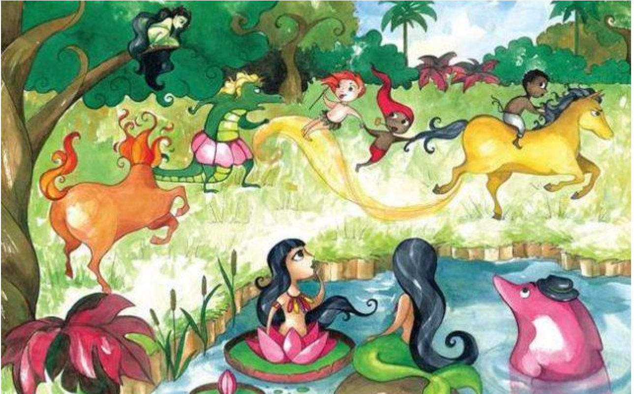
Banana – bananeira / pé de banana