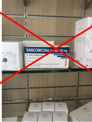
Tabella 4 RR