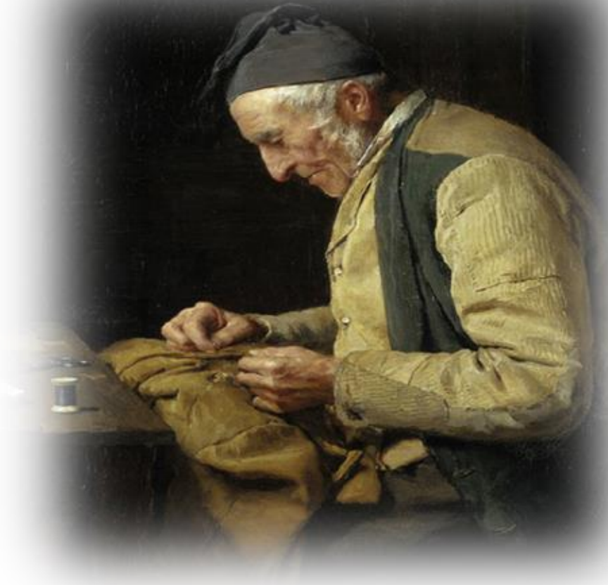
Albert Anker, Il sarto del villaggio (1894)