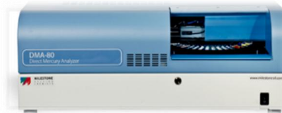
Analizzatore Diretto di Mercurio (DMA-80)