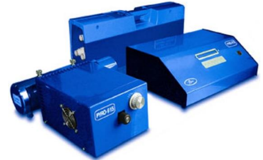
Analizzatore di Mercurio elementare e speciazione in fase solida Lumex (RA-915M e PYRO-915)