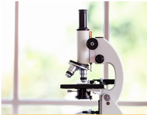
LES SCIENCES DE LA VIE ET DE LA TERRE