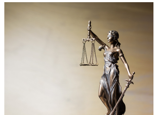
L'ENSEIGNEMENT MORAL ET CIVIQUE