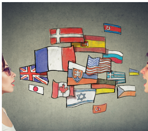
LES LANGUES VIVANTES