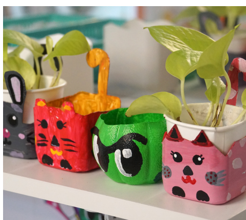
LES ARTS PLASTIQUES