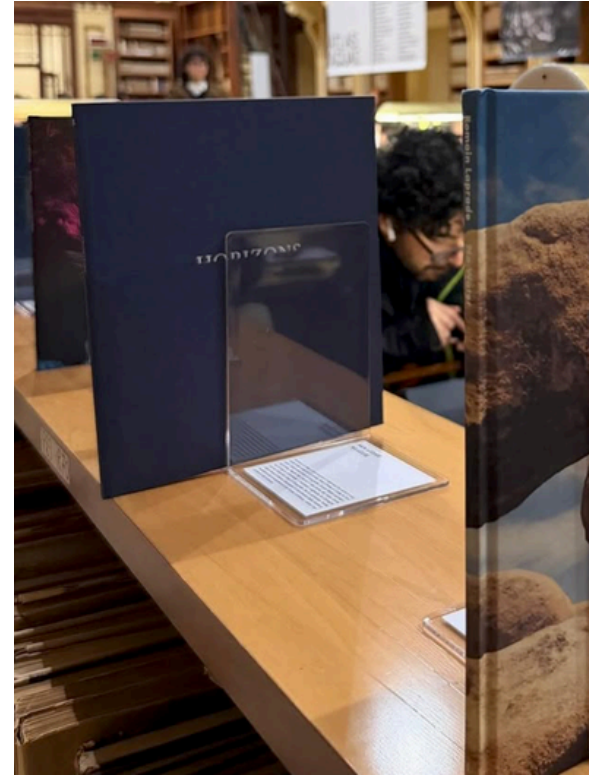
Immagini delle mostre Atlas Aquæ e Natura Extensa prodotte da OMNE