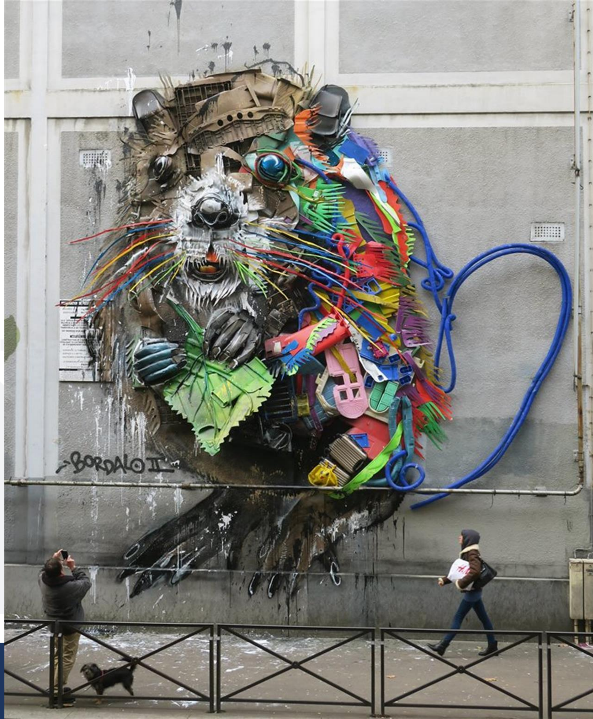
Bordalo Topo , Parigi 2019