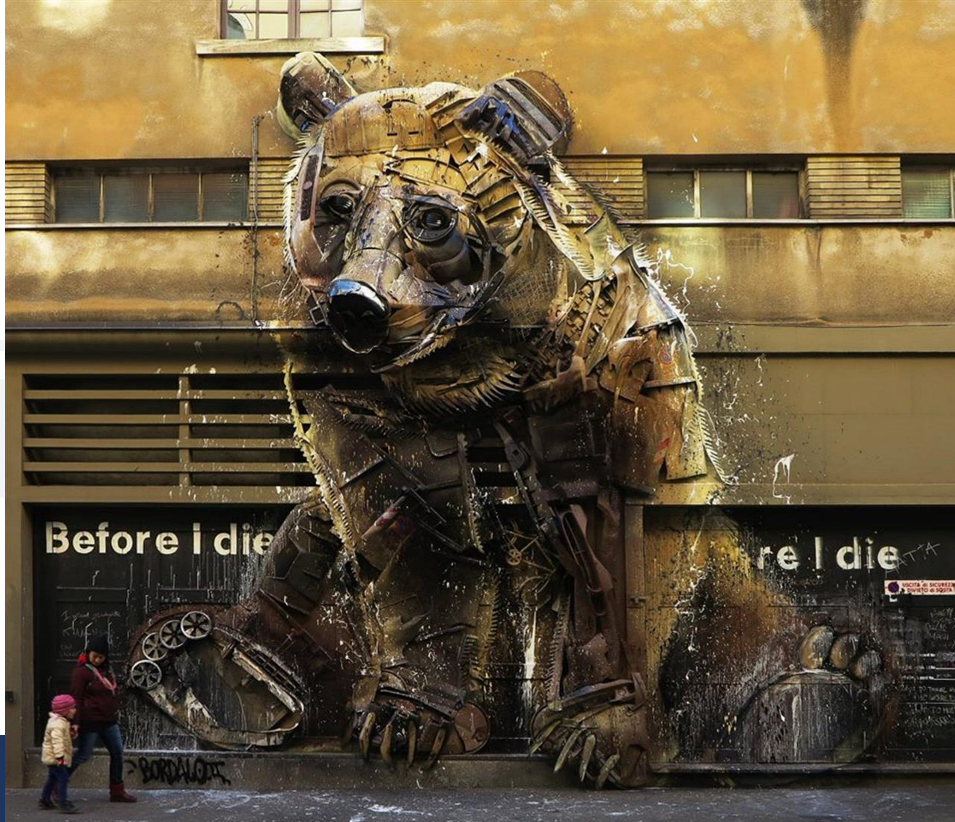
Bordalo Orso , Torino 2016