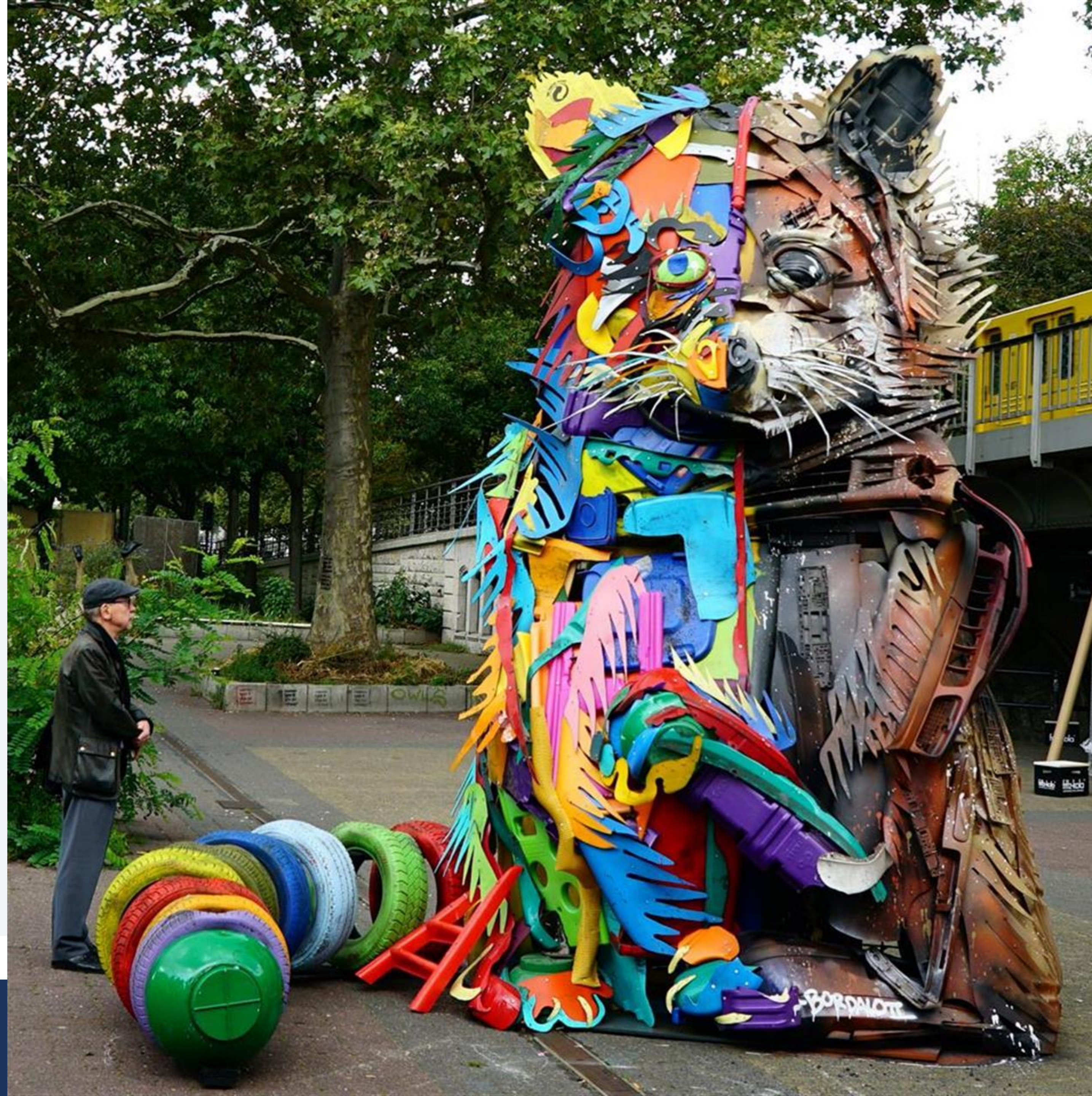
Bordalo Gatto , Berlino 2019