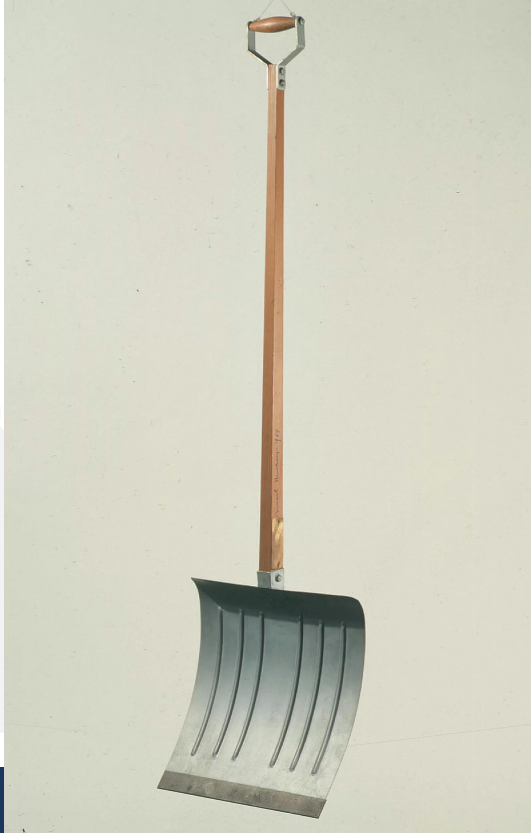
Marcel Duchamp In Advance of the Broken Arm, 1915