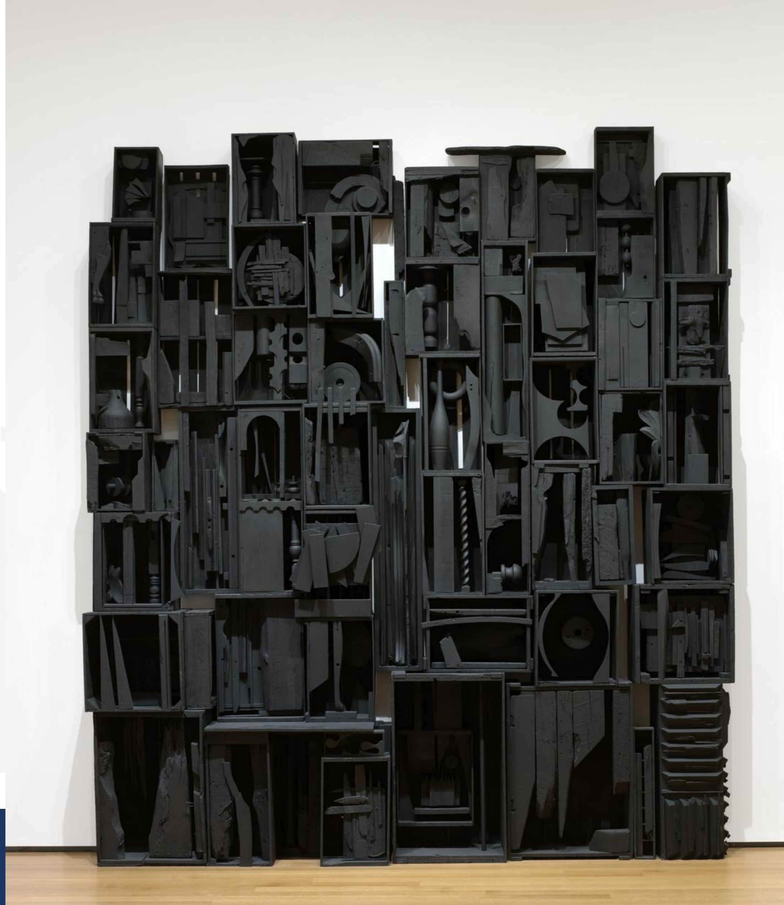
Louise Nevelson La cattedrale del cielo, 1958