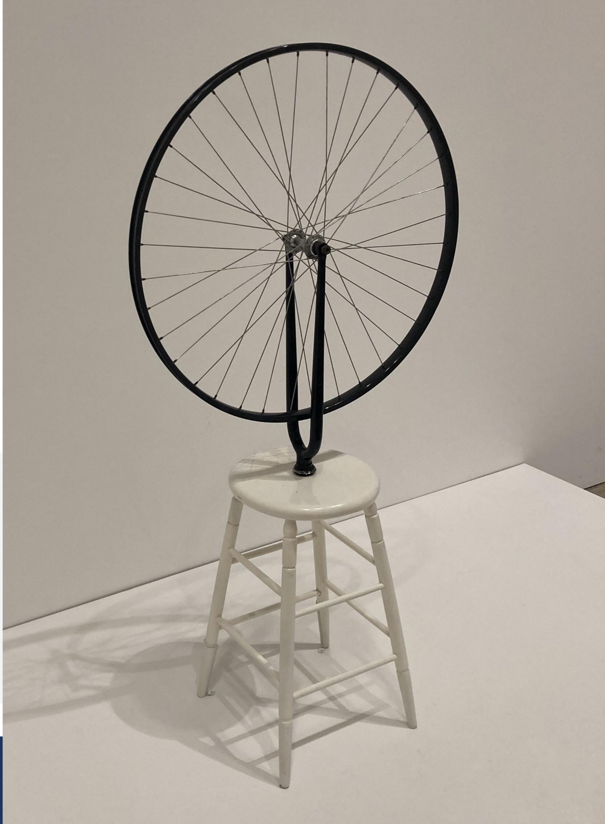
Marcel Duchamp Ruota di bicicletta, 1913