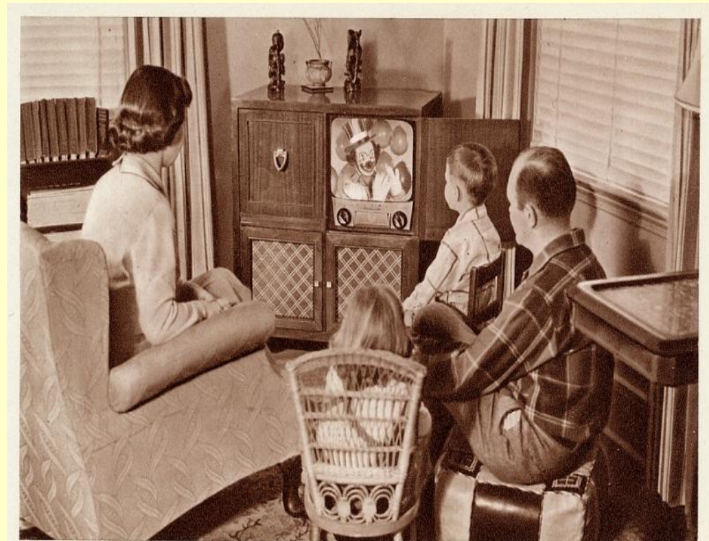
LA TELEVISIONE - Tutta la famiglia assiste a uno spettacolo divertente. Certo è cosa incredibile che grazie alla corrente elettrica si riproducano immagini e voci!